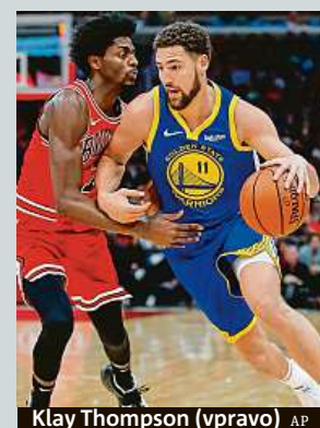
Klay Thompson (vpravo)

Rekordní střelecký výkon předvedl Klay Thompson, který 14 úspěšnými trojkovými pokusy pomohl basketbalistům Golden State v NBA k vítězství 149:124 nad Chicagem. Osmadvacetiletý rozehrávač o jednu trojku překonal dva roky staré maximum týmového kolegy Stephena Curryho a celkem si připsal 52 bodů, což je i nový nejlepší výkon sezony. ČTK