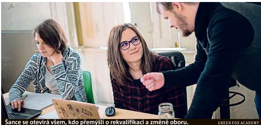
Šance se otevírá všem, kdo přemýšlí o rekvalifikaci a změně oboru.

Dámy dále zvažují všechny požadavky zaměstnavatele a mnohdy se při tom projeví jejich nízké sebevědomí. „Pokud žena usoudí, že něco neumí, tak o místo nepožádá, ač