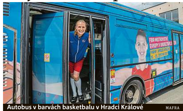
Autobus v barvách basketbalu v Hradci Králové

Kraj předpokládá, že smlouvy s vítězi by hejtmantství mohlo uzavřít na přelo-