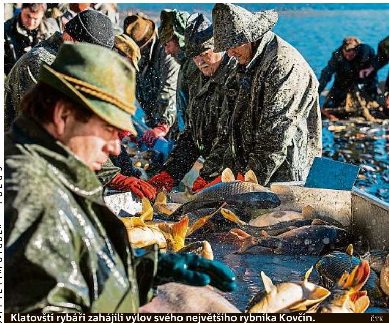
Klatovští rybáři zahájili výlov svého největšího rybníka Kovčín.