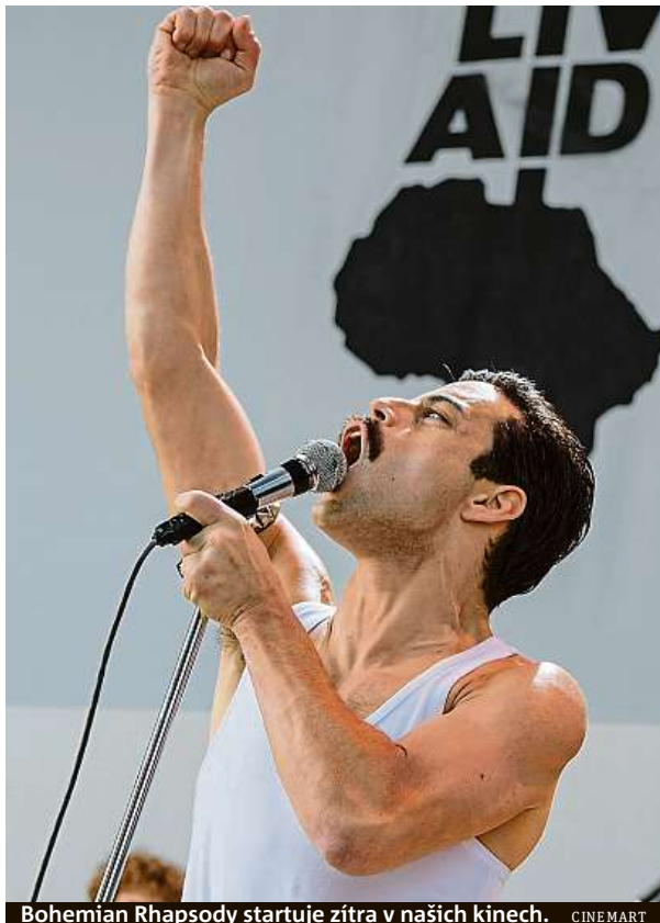
Bohemian Rhapsody startuje zítra v našich kinech. CINEMART

Film Bohemian Rhapsody oslavuje tvorbu skupiny Queen. Kdo chce životopis, ať si pustí dokument.