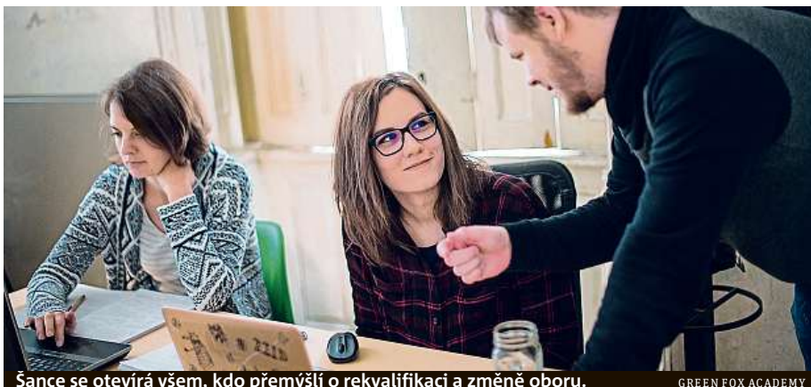
Šance se otevírá všem, kdo přemýšlí o rekvalifikaci a změně oboru.

Dámy dále zvažují všechny požadavky zaměstnavatele a mnohdy se při tom projeví jejich nízké sebevědomí. „Pokud žena usoudí, že něco neumí, tak o místo nepožádá, ač