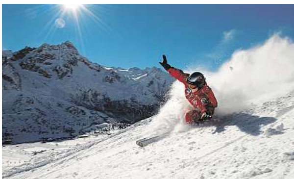
Areál Passo Tonale je opravdu vysokohorský.

Dalším unikátem je nejvyšše položená sauna v Evropě. Tu najdete v nadmořské výšce 2845 metrů u horské chaty Schöne Aussicht. O té se navíc také říká, že tu vaří ty nejlepší knedlíky v Jižním Tyrolsku.