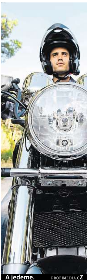
A jedeme.

„Po letošním roce opět zdrazíme, neboť při výcviku a zkouškách neustále brzdění a rozjezdy ničí gumy, kotouče a destičky a zvyšují se nám náklady,“ říká Pavel Plzenský z Autoškoly Letná. Ten komentuje úkony, které se žáci už rok musí učit, aby prospěli u závěrečných zkoušek.