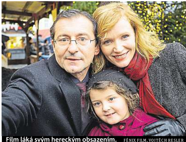
Film láká svým hereckým obsazením.

Pohádky pro Emu je příběh o hledání lásky, která může mít mnoho tváří a může být schována hluboko v nás, a proto je třeba si sáhnout pro ni až na dno. Jaká je zápletka? Ondřej Vetchý alias Petr Miller pra-