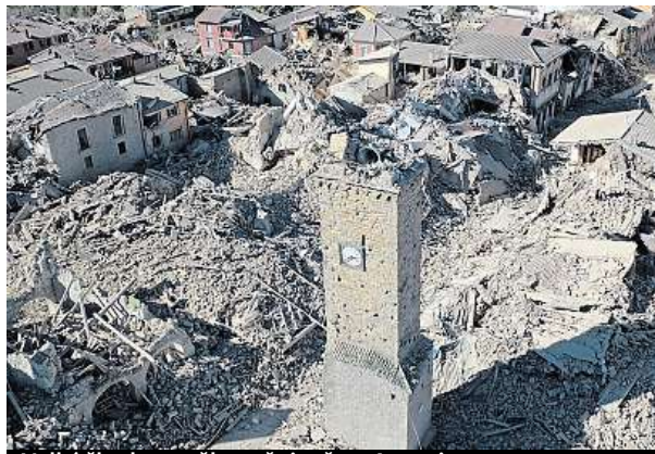
Velké škody utrpělo opět i město Amatrice. VIGILI DEL FUOCO

• Předchozí srpnová katastrofa si ve stejném regionu vyžádala asi 300 životů.