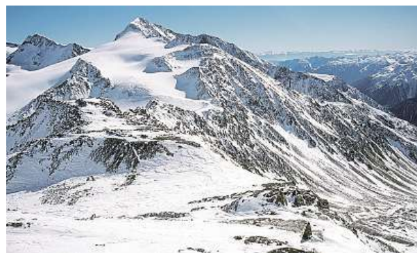
Schnalstalský ledovec má široké sjezdovky.

Stubaiský ledovec je v Rakousku největší oblastí, kde je možné si zalyžovat na ledovci v nadmořské výšce nad 3000 metrů. Nabízí 34 sjezdovek všech obtížností. Lyžařský areál se otevřel už koncem října.