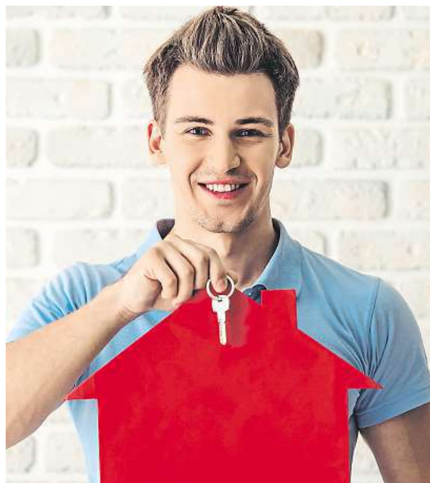
I na hypotéku se nyní musí šetřit.

Minimálně pět procent musí klient financovat z vlastních zdrojů. Prozatím to nabídky bank nijak zvlášť neovlivnilo. Větších změn se dočkáme v prosinci, kdy začne platit velká novela o spotřebitelském úvěru. iDNES.cz