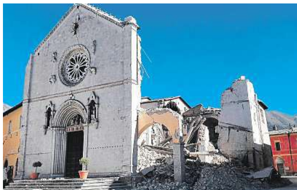
V historickém městečku Norcia se zřítily dva kostely včetně katedrály svatého Benedikta. Záchranáři k vyproštění lidí používali také cvičené psy.