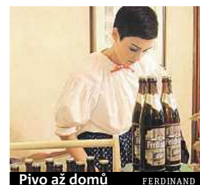
Pivo až domů FERDINAND

Pivovar Ferdinand, který ovládl kategorii české pivo v soutěži Česká chuťovka se svým speciálem Max, vylepšuje pro své příznivce službu Ferdadomu.cz. S její pomocí rozváží pivovar svůj sortiment zákazníkům. Služba se osvědčila, a tak Ferdinand připravil novinku v podobě její mobilní aplikace. METRO