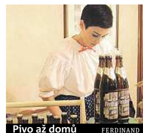
Pivo až domů FERDINAND

Pivovar Ferdinand, který ovládl kategorii české pivo v soutěži Česká chuťovka se svým speciálem Max, vylepšuje pro své příznivce službu Ferdadomu.cz. S její pomocí rozváží pivovar svůj sortiment zákazníkům. Služba se osvědčila, a tak Ferdinand připravil novinku v podobě její mobilní aplikace. METRO