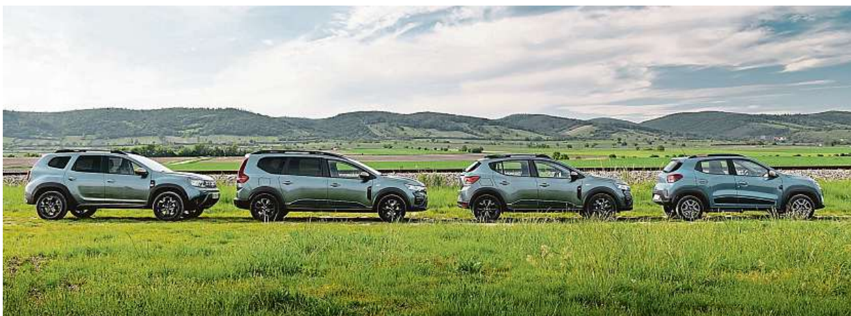
Nové modely Dacia můžete vyzkoušet během deseti dnů ode dneška až do 17. září.