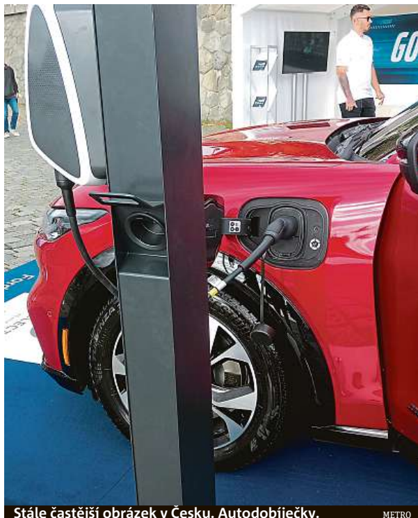
Stále častější obrázek v Česku. Autodobíječky.

„Zákazníky oslovila zcela jiná karoserie v porovnání s klasikou, to je jeden z důvodů, proč vůz chtějí a současně jim elektrický pohon vyhovuje a současně jsou i fanoušci moderních technologií,“ dodává prodejce k elektromobilu, které si průběžně může na dálku stahovat nejruznější aktualizace softwaru, kte-