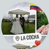
Jaro Dolejš Moment... na odpověď se musím zeptat manželky.