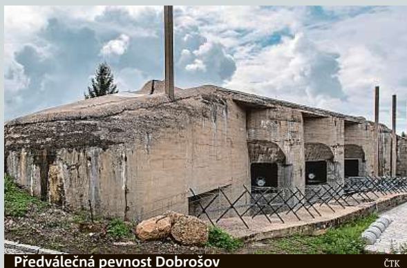
Předválečná pevnost Dobrošov