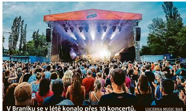
V Braníku se v létě konalo přes 30 koncertů. LUCERNA MUSIC BAR

Hluk z koncertů otravuje Braník. Snažíme se chovat zodpovědně, brání se pořadatel.