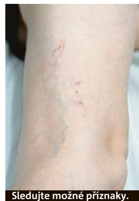
Sledujte možné příznaky.

„Vyvolávajícími faktory trombózy jsou především nádorová onemocnění, úrazy, operační výkony, imobilizace končetiny po úrazu, užívání hormonální antikoncepce, těhotenství a u pacientů s vyšším sklonem ke sražení dokonce i dehydratace, věk, obezita či dlouhá cesta dopravním prostředkem. Ke vzniku trombózy je však většinou zapotřebí více těchto nepříznivých okolností najednou,“ popisuje doktorka Kateřina Pinterová z laboratoře Synlab.