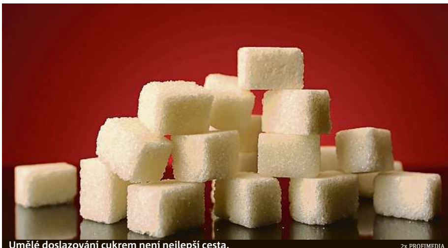
Umělé doslazování cukrem není nejlepší cesta.

Cukry se ale z jídelníčku zcela odstranit nemohou. Tělo je potřebová. Cukr je složka sacharidů, které jsou jednou ze základních živin organismu a hlavním zdrojem energie ve stravě. Při jejich nedostatku se mohou vytvořit z bílkovin, ale proces vede ke zhoršení stavu svalové hmoty, snížení jejího množství a zhoršení činnosti jater