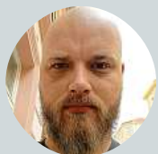
Jakub Stupka Inteligenci, toleranci, smysl pro humor.