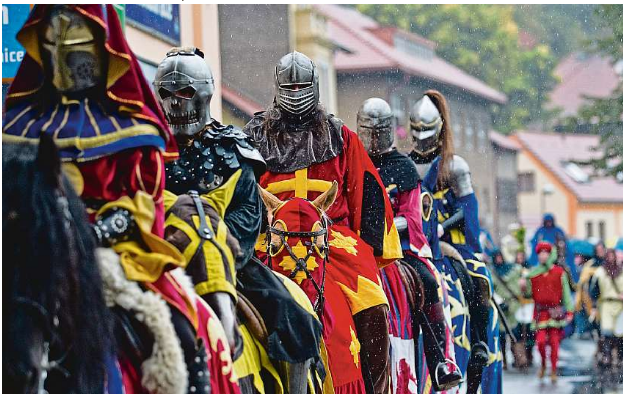
Tradiční průvod v historických kostýmech na Karlštejském vinobraní

Na každém vinobraní probíhá ochutnávka vín z minulých ročníků. Náš unikát, burčák, teče proudem! Hudba hraje k tanci a poslechu. A samozřejmě nechybí spousta dobrého jídla. Někdy jsou součástí různé scénky a taneč-