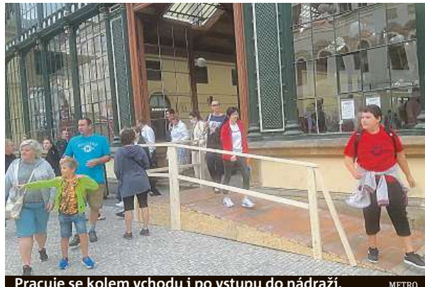
Pracuje se kolem vchodu i po vstupu do nádraží.

Na řadu má přijít odstranění nevzhledného novínového stánku v rohu odjezdové halý. Ten získá novou podobu a zároveň se rozdvíjí. Druhý stánek totiž vznikne ve vnitřní chodbě nádraží podle Hybernské ulice. „V odjezdové hale pak bude nový provozov-