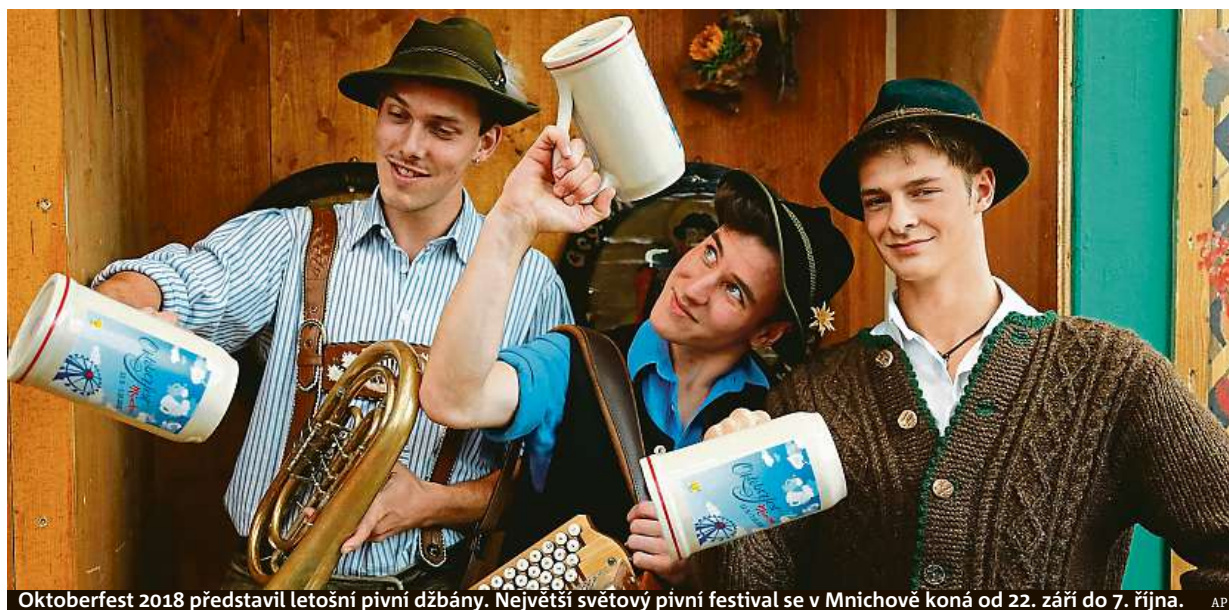
Oktoberfest 2018 představil letošní pivní džbány. Největší světový pivní festival se v Mnichově koná od 22. září do 7. října.

Důvod obědvat. Bez poukázky na jídlo vynecháme restauraci a stravu si do zaměstnání vezmeme raději z domova. Papírová podoba. Se stravenkami v elektronické verzi je víc práce, stěžují si restauratěři STRANA 2