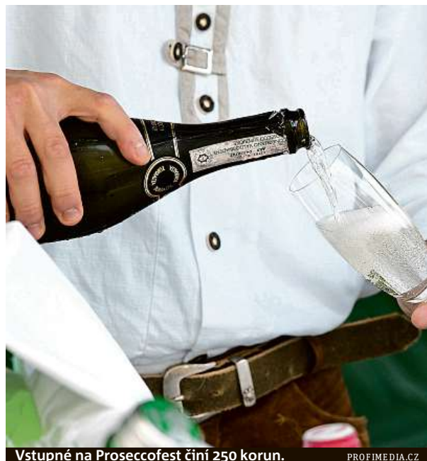
Vstupné na Proseccofest činí 250 korun.

Vstupné je 250 Kč, v ceně jsou tři degustační žetony a sklenička. Prosecco je vinařská oblast na severovýchodě Itálie představující dva regiony – Veneto a Friuli ohraničené Dolomity a Jaderským mořem. Díky tomu tu jedinečné klima vytvářejí osobitý charakter vín. HOPE