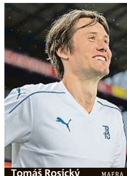
Tomáš Rosický

Projekt Můj první gól se skládá z několika důležitých pilířů. Stěžejním z nich je Měsíc náborů, který startuje právě začátkem po celé republice série fotbalových náborů (vybrané najdete v boxu). Náborů nejbližší vašemu bydlišti najdete na oficiálních stránkách mujprvniGol.cz .