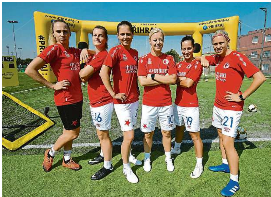
Fotbalistky pražské Slavie patří k nejlepším ženským týmům v Evropě.