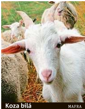
Koza bílá MAFRA

Studie naznačuje, že lidské emoce dokážou rozlišovat i jiná zvířata než domácí mazlíčci.