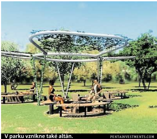
V parku vznikne také altán.

Na děti ale architekti parku myslí ještě více. Plánují tu totiž také například pískoviště nebo přírodní hřiště z klád