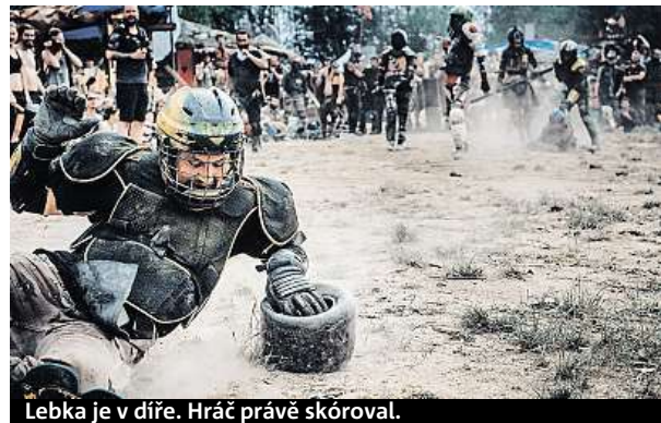
Lebka je v díře. Hráč právě skóroval.