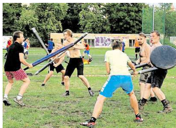
V Riegrových sadech se hraje bezkontaktní jugger.