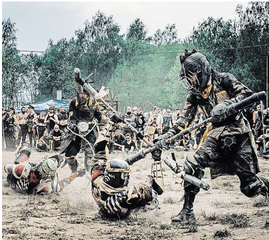
Masky, souboje a modřiny – to je jugger. Tedy jeho ostřejší verze.