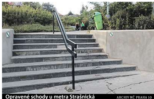
Opravené schody u metra Strašnická

V pravidlech ale dochází k několika změnám. Věková hranice pro podávání návrhů je snížena na 15 let a organizátoři si od toho slibují větší zapojení středoškoláků. Další novinkou je rozdělení návrhů do dvou kategorií: na velké (500 tisíc až milion korun) a malé projekty (od 50 do 500 tisíc korun). PAVEL URBAN