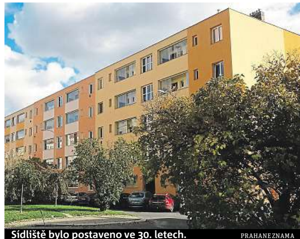
Sídliště bylo postaveno ve 30. letech.

Navic byli tehdejší architekti převážně levicově zaměření a počítali, že vývojem společnosti dokonce dojde ke zrušení rodiny jako buržoazního přežitku. „Levicoví architekti strašně litovali, že je