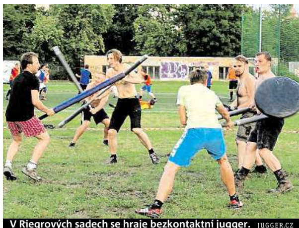
V Riegrových sadech se hraje bezkontaktní jagger. JIGGER.CZ