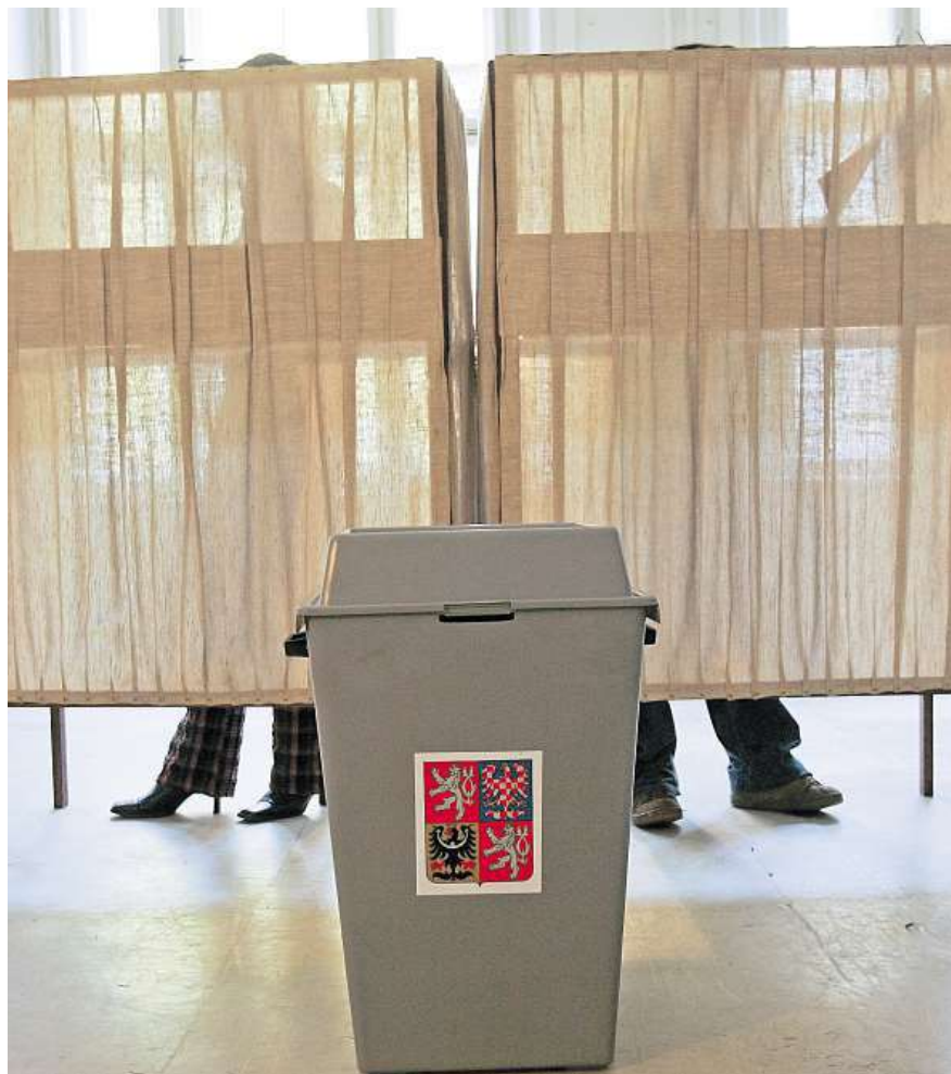
První kolo senátního voleb proběhne 7. a 8. října.