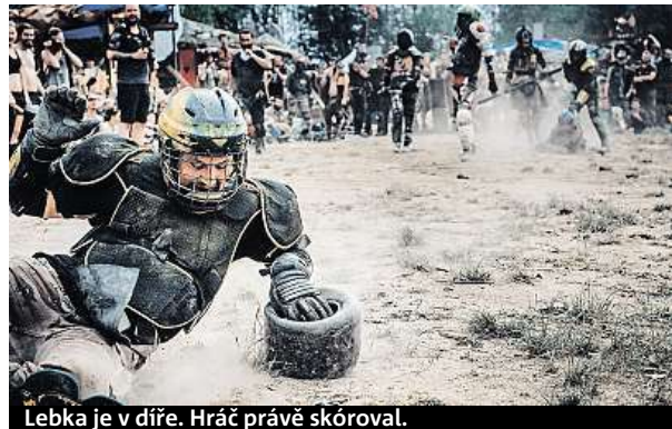
Lebka je v díře. Hráč právě skóroval.