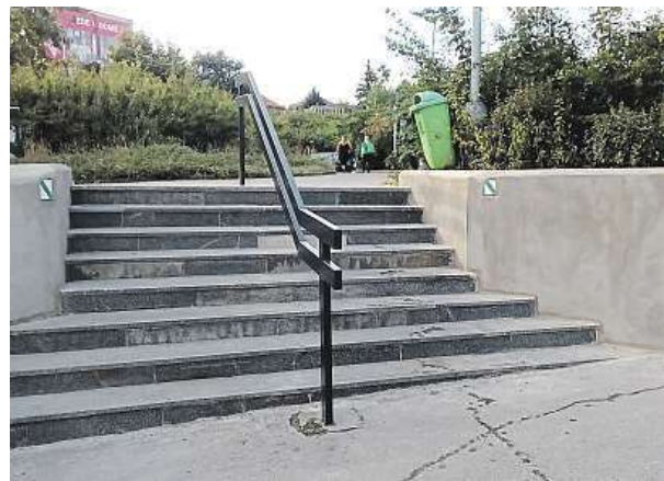
Opravené schody u metra Strašnická

V pravidlech ale dochází k několika změnám. Věková hranice pro podávání návrhů je snížena na 15 let a organizátoři si od toho slibují větší zapojení středoškoláků. Další novinkou je rozdělení návrhů do dvou kategorií: na velké (500 tisíc až milion korun) a malé projekty (od 50 do 500 tisíc korun). PAVEL URBAN