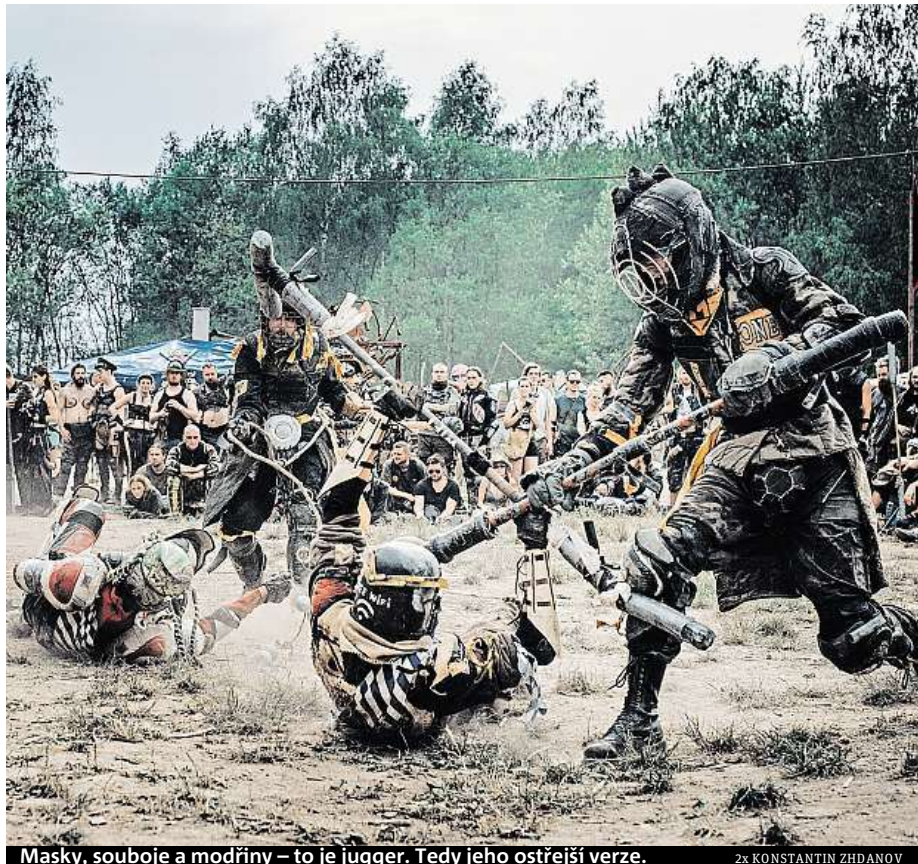
Masky, souboje a modřiny – to je jagger. Tedy jeho ostřejší verze.