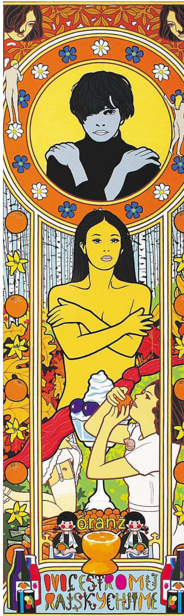
Takhle vidí film Ovoce stromů rajských jíme.

Výstavu můžete navštívit do konce října. MET