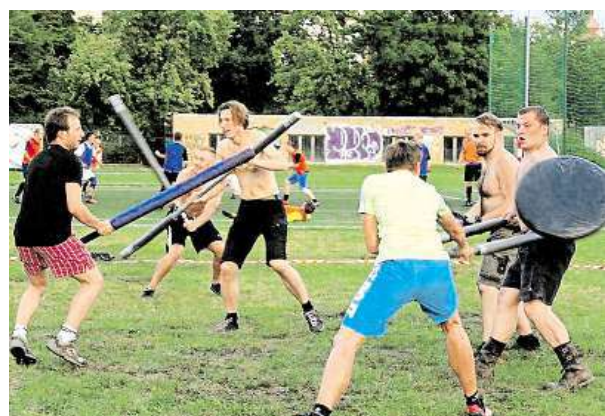
V Riegrových sadech se hraje bezkontaktní jugger.