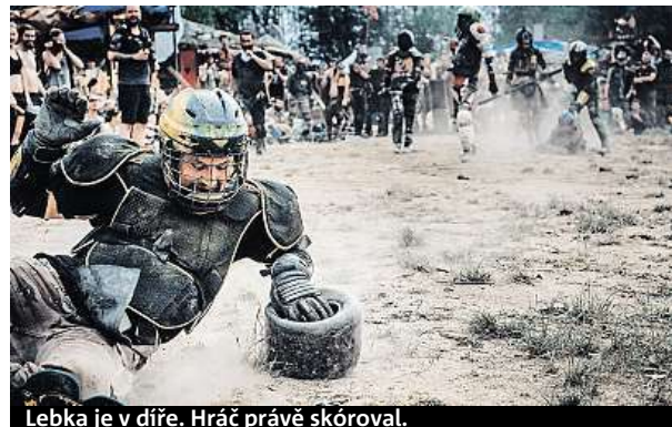
Lebka je v díře. Hráč právě skóroval.