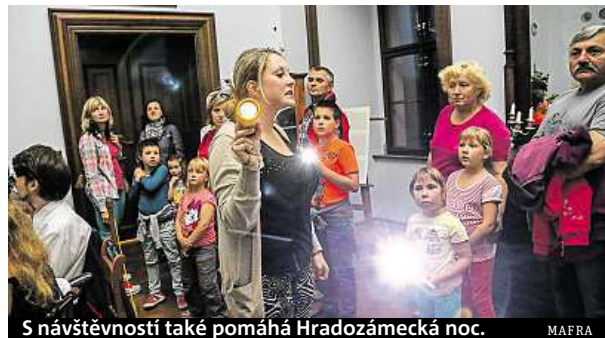
S návštěvností také pomáhá Hradozámecká noc. MAFRA

o 40 procent lidí víc. Oblíbený zůstal tradičně Karlštejn, na něj dorazilo o 35 tisíc návštěvníků více, na Hlubokou o 30 tisíc. „Hlavní trasu máme po sedmi minutách. Ostatní trasy chodíme po půl hodině, a když je potřeba, tak po 15 minutách. Když nám průvodci dojdou, tak provází zaměstnanci. Kromě 15 prů-