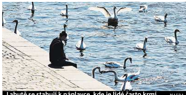
Labutě se stahují k náplavce, kde je lidé často krmí.

něco k snědku, tak ukázněni, jak by měli. „Ptáci nejsou hloupí a sdružují se tam, kde