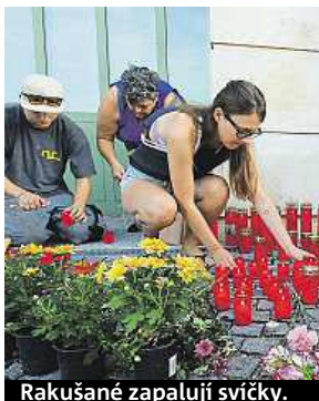
Rakoušané zapalují svíčky.

Novým zatčeným má být opět Bulhar. Mělo by se jednat o majitele nebo řidiče nákladního auta. První čtyři podezřelí – tři Bulhaři a jeden Afghánec – byli zadrženi ve čtvrtek a soud v maďarském Kecskemétu na ně v sobotu uvalil měsíční vazbu.