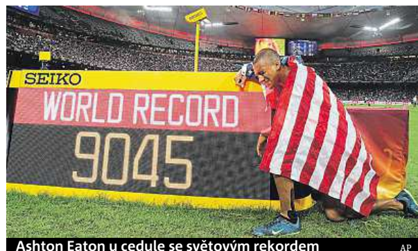
Ashton Eaton u cedule se světovým rekordem

Třetí triumf v Ptačím hnízda vyvolal jamajský sprinter Usain Bolt, který finišoval u štafety na 4x100 metrů. Sobotním králem se však stal americký desetibojař Ashton Eaton. Ten ovládl dvoudenní závod v novém světovém rekordu 9045 bodů. Přitom dva roky desetiboj neabsolvoval. „Ale hodně lidí při mně stálo, říkali mi, abych si to hlavně pořádně užil. Tak jsem je poslechl. Byl to parádní závod,“ řekl Eaton. PUR a ČTK