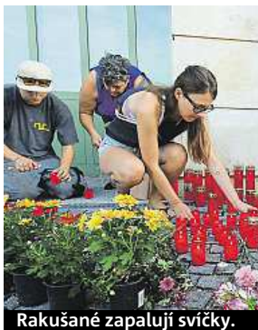
Rakušané zapalují svíčky.

Novým zatčeným má být opět Bulhar. Mělo by se jednat o majitele nebo řidiče nákladního auta. První čtyři podezřelí – tři Bulhaři a jeden Afghánc – byli zadrženi ve čtvrtek a soud v maďarském Kecskemétu na ně v sobotu uvalil měsíční vazbu.