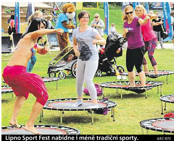
Lipno Sport Fest nabídne i méně tradiční sporty.

Hory zažívají renesanci. Češi se sem učí jezdit i v létě. Třeba nejznámější horské středisko Špindlerův Mlýn je oblíbeným turistickým místem už také přes léto. Kromě hor a zdravého vzduchu sem hosty táhne také letní zábava. Skiareál letos pro návštěvníky nově vybudoval půjčovnu šlapacích bugin, elektročtyřkolek a elektrokol v centru města. Rozšířil nabídku loděk a paddleboardů na Labské přehradě. A zkusit si můžete také velké trampolínové hřiště na Medvědině. „Půjčit si můžete čtyřkolkou E-Grand Tour s elektrickým