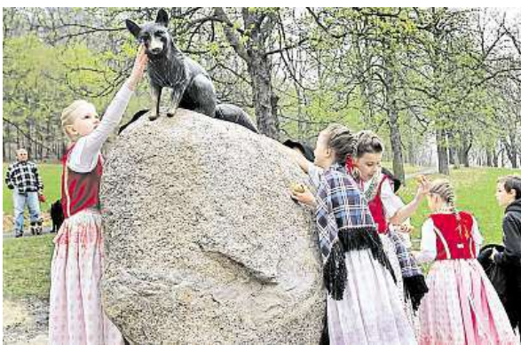
Liška Bystrouška v Hukvaldech