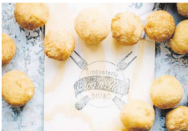
Krokety, kam se podíváš.