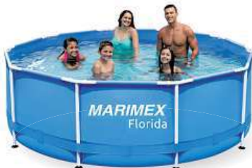
3v1, Chlor Komplex 5v1 anebo Minitabs.

Díky nim lze zjistit koncentraci chloru i pH vody a závčasů tak zabránit nechtěným řasám, tvorbě zákalů či podráždění pokožky. Vyvážení výsledného pH se koriguje přípravky pH- a pH+. Chlorové přípravky, které zajišťují dezinfekci bazénové vody, jsou pak Chlor Triplex