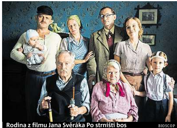
Rodina z filmu Jana Svěráka Po strništi bos

Týden nato se pomějí také fanoušci románů spisovatele Stepheny Kinga. Do kin se konečně chystá dlouho očekávaná adaptace jednoho z jeho nejslavnějších děl podle stejnojmenného románu Temná věž . Děj hororového westernu se točí kolem pistolníka Rolanda Deschaina s tvářemi Idrise Elby, který putuje k Temné věži, aby se tu pokusil zastavit zkázu Středosvěta. Pronásleduje Muže v černém (Matthew McConaughey), jenž je mocný mág a možná i samotný anděl smrti. Cestou naráží