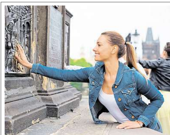
Na Karlově mostě se vám splní přání třikrát

Ani Náchod není pozadu. „Na Karlově náměstí máme podkovu Fridricha Falckého, kterou zde dle pověsti ztratil jeho kůň v roce 1620 při útěku z Čech. Šlápnutí na podko-