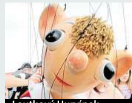
Loutkový Hurvínek