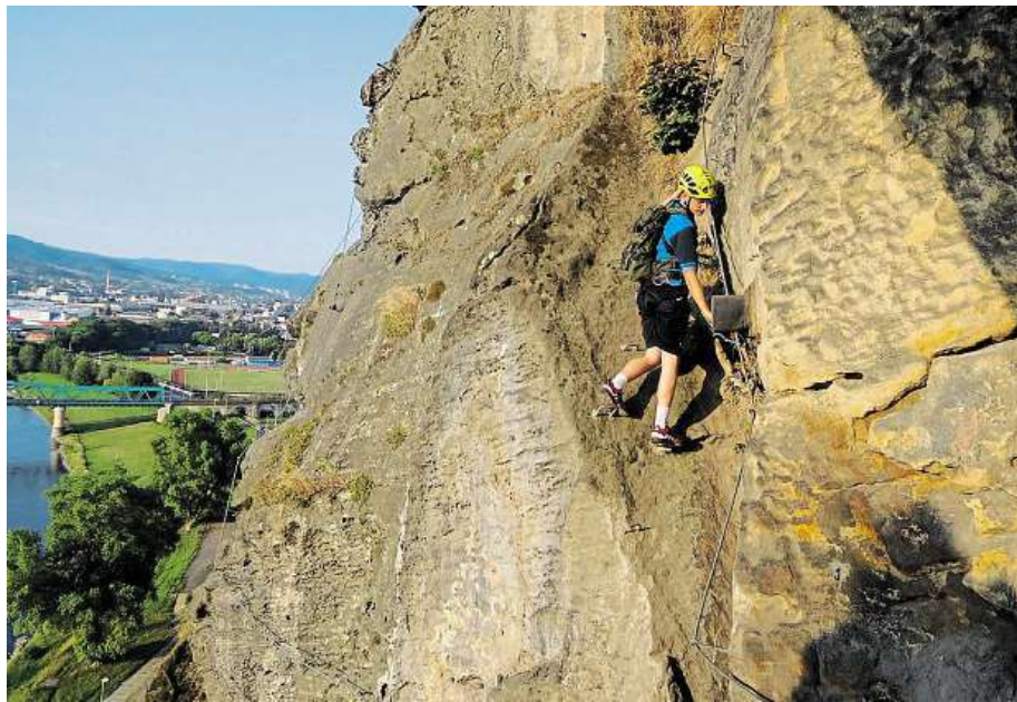
Via ferrata na Pastýřské stěně v Děčíně