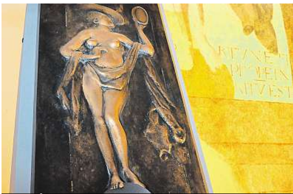
Reliéf Štěstěny vrtkavé