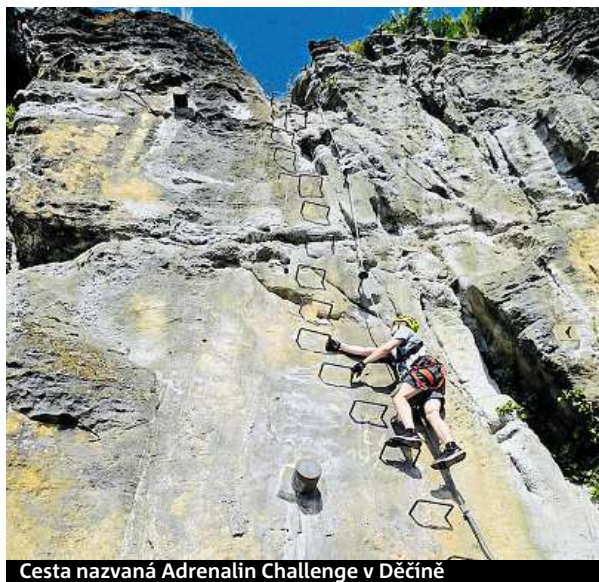
Cesta nazvaná Adrenalin Challenge v Děčíně