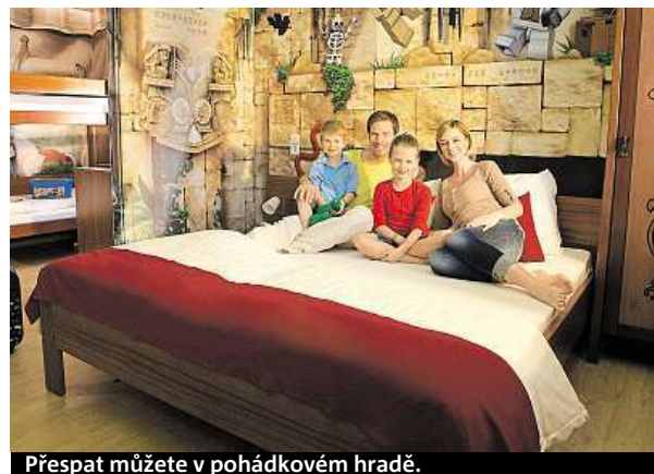
Přespat můžete v pohádkovém hradě.