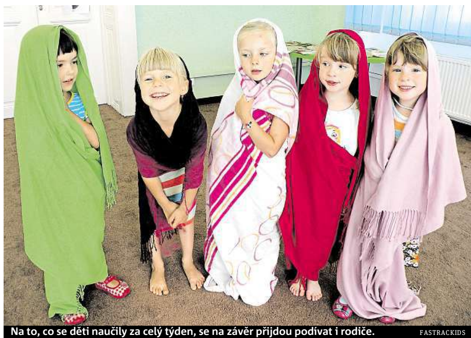
Na to, co se děti naučily za celý týden, se na závěr přijdou podívat i rodiče.

Pokud je vaše dítě filmový nadšenec, pak by rozhodně mělo zamířit na filmově-herectvský tábor společnosti Děti a divadlo. Koná se od 14. do 18. srpna v mateřské škole Sluníčkov ve Kbělich.