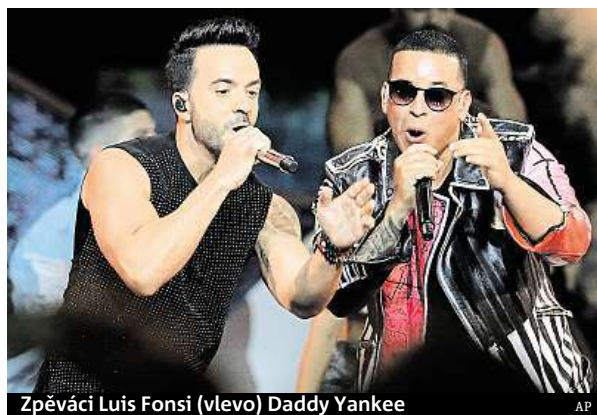
Zpěváci Luis Fonsi (vlevo) Daddy Yankee

Nedávno ji také použil venezuelský prezident Nicolás Maduro pro svou kampaň. Do úspěšné písničky přidal vlastní text a použil ji na svém politickém shromáždění. Ma-