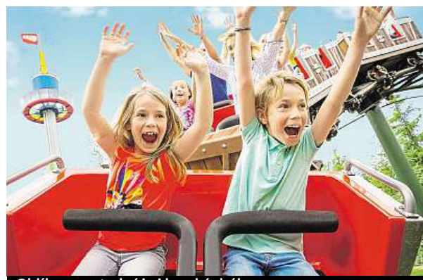
Oblíbenou atrakcí je i horská dráha.