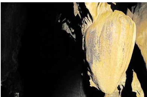
Stalaktit ve tvaru srdce v jeskyni Na Pomezí