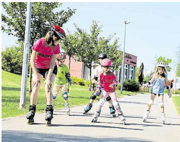
Naučit se na inline bruslích zvládnou děti za pár dnů.