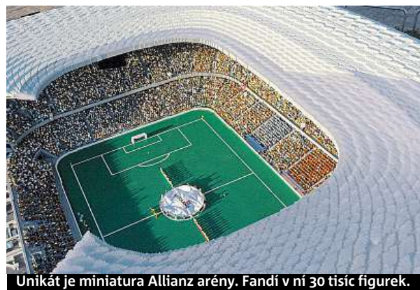
Unikát je miniatura Allianz arény. Fandí v ní 30 tisíc figurek.