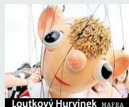
Loutkový Hurvínek

Asi Mánička. V divadle je trochu prudič a pořád Hurvínka opravuje a umravňuje. To by ve filmu hodinu a půl nemohlo fungovat, protože by nás všechny začala po chvíli dost otravovat. V Máničce jsme proto museli objevit silnější kamarádkové a partácké instinkty. Ve velkém dobrodružství nemůže nechat Hurvínka samotného a musí mu krýt záda a podporovat ho, když to potřebuje. Ale drobné pruzení a ironii si samozřejmě neodpustí. Navíc je krásná. FILIP JAROŠEVSKÝ