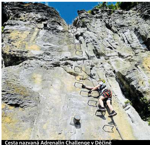
Cesta nazvaná Adrenalin Challenge v Děčíně