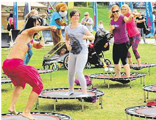
Lipno Sport Fest nabídne i méně tradiční sporty.

Hory zažívají renesanci. Češi se sem učí jezdit i v létě. Třeba nejznámější horské středisko Špindlerův Mlýn je oblíbeným turistickým místem už také přes léto. Kromě hor a zdravého vzduchu sem hosty táhne také letní zábava. Skiareál letos pro návštěvníky nově vybudoval půjčovnu šlapacích bugin, elektročtyřkolek a elektrokol v centru města. Rozšířil nabídku loděk a paddleboardů na Labské přehradě. A zkusit si můžete také velké trampolínové hřiště na Medvědině. „Půjčit si můžete čtyřkolku E-Grand Tour s elektrickým