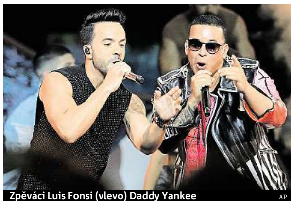
Zpěváci Luis Fonsi (vlevo) Daddy Yankee

Nedávno ji také použil venezuelský prezident Nicolás Maduro pro svou kampaň. Do úspěšné písničky přidal vlastní text a použil ji na svém politickém shromáždění. Ma-