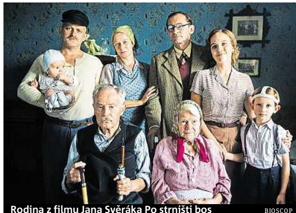
Rodina z filmu Jana Svěráka Po strništi bos

Týden nato se pomějí také fanoušci románů spisovatele Stephen Kinga. Do kin se konečně chystá dlouho očekávaná adaptace jednoho z jeho nejslavnějších děl podle stejnojmenného románu Temná věž. Děj hororového westernu se točí kolem pistolníka Rolanda Deschaina s tváří Idrise Elby, který putuje k Temné věži, aby se tu pokusil zastavit zkázu Středosvěta. Pronásleduje Muže v černém (Matthew McConaughey), jenž je mocný mág a možná i samotný anděl smrti. Cestou narazí