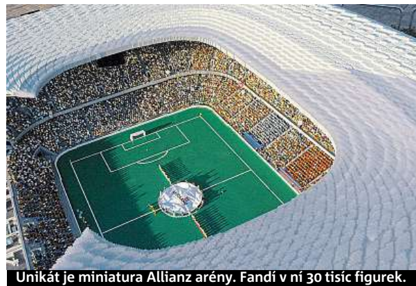
Unikát je miniatura Allianz arény. Fandí v ní 30 tisíc figurek.