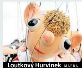
Loutkový Hurvínek