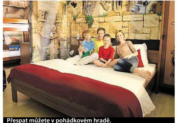
Přespat můžete v pohádkovém hradě.