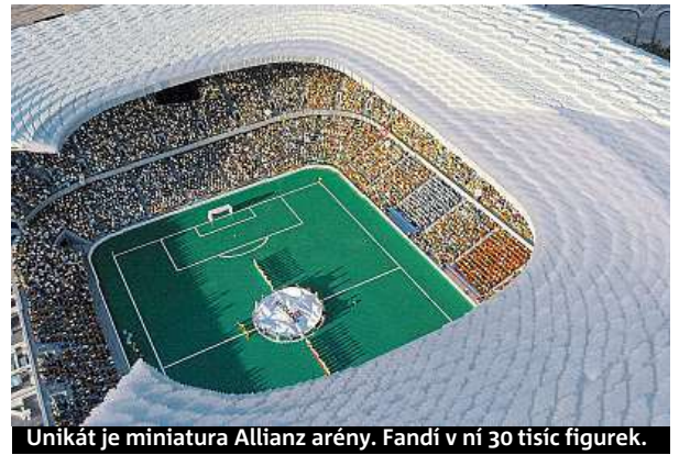
Unikát je miniatura Allianz arény. Fandí v ní 30 tisíc figurek.