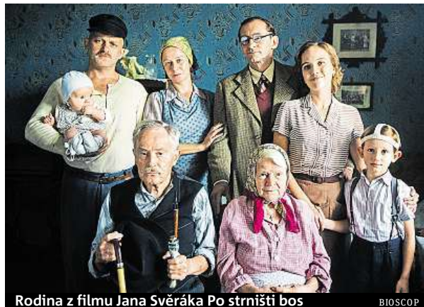
Rodina z filmu Jana Svěráka Po strništi bos

Týden nato se pomějí také fanoušci románů spisovatele Stephen Kinga. Do kin se konečně chystá dlouho očekávaná adaptace jednoho z jeho nejslavnějších děl podle stejnojmenného románu Temná věž. Děj hororového westernu se točí kolem pistolníka Rolanda Deschaina s tváří Idrise Elby, který putuje k Temné věži, aby se tu pokusil zastavit zkázu Středosvěta. Pronásleduje Muže v černém (Matthew McConaughey), jenž je mocný mág a možná i samotný anděl smrti. Cestou narazí