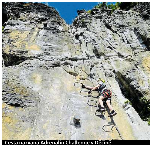
Cesta nazvaná Adrenalin Challenge v Děčíně