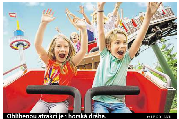
Oblíbenou atrakcí je i horská dráha.