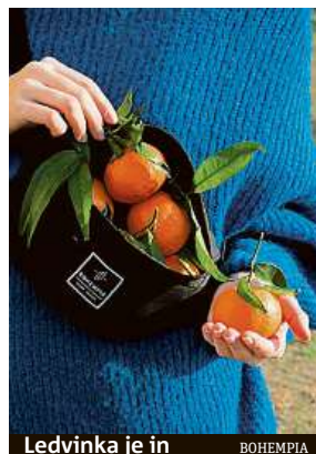
Ledvinka je in