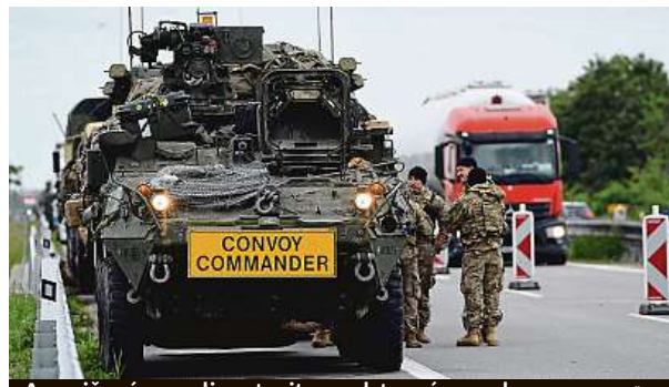
Američané museli zastavit na odstavěm pruhu.

každoročně. Někteří Češi, kteří nemuseli na cestu po dálnici vyrazit, si dělali na internetu legraci. Mnohdy situaci komentovali podobnými slovy jako: „O bezpečnost Česka nemám strach, případné invazní vojsko nebude mít šanci se na našem území pohybovat.“ IDNES.cz, MET