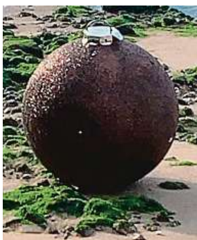
Vánoční ozdoba TWITTER

ny vánočního stromku a Santa Clause. K vánoční kouli připomínající nevybuchlou bombu z války přivolali lidé v Londýně policisty několik dní poté, co se ve městě Kingston-upon-Thames, které leží jihozápadně od britské metropole, našla skutečná nevybuchlá puma. Kvůli zneškodnění museli být evakuováni studenti univerzity. ČTK