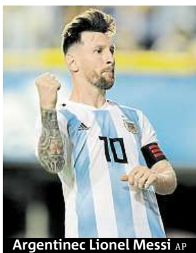
Argentinec Lionel Messi

Smutná zpráva pro Egypt přišla z Liverpoolu. Útočník obou celků Mohamed Salah totiž zmešká začátek mistrovství světa. Kvůli poraněnému ramenu z finále Ligy mistrů bude chybět až čtyři týdny. Egypt vstoupí do MS 15. června zápasem s Uruguayí. O čtyři dny později ho čeká Rusko a 25. června Saúdská Arábie.