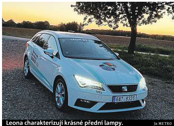
Leona charakterizují krásné přední lampy.