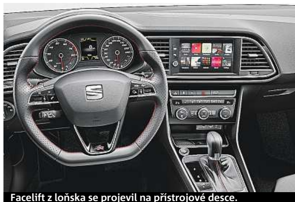
Facelift z loňska se projevil na přístrojové desce.