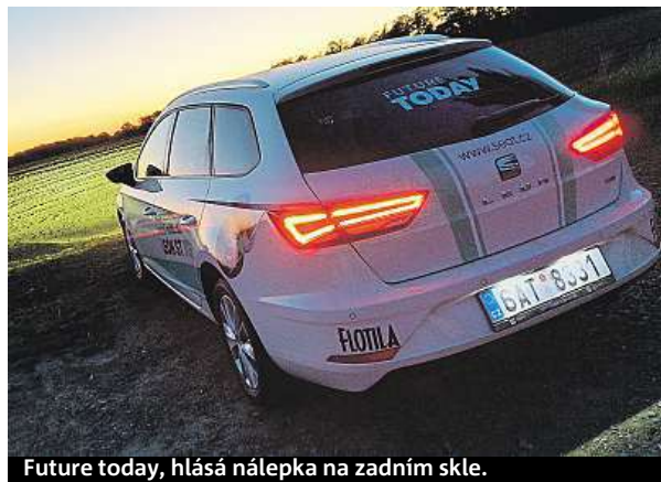
Future today, hlásá nálepka na zadním skle.