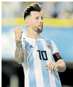
Argentinec Lionel Messi

Smutná zpráva pro Egypt přišla z Liverpoolu. Útočník obou celků Mohamed Salah totiž zmešká začátek mistrovství světa. Kvůli poraněnému ramenu z finále Ligy mistrů bude chybět až čtyři týdny. Egypt vstoupí do MS 15. června zápasem s Uruguayí. O čtyři dny později ho čeká Rusko a 25. června Saúdská Arábie.