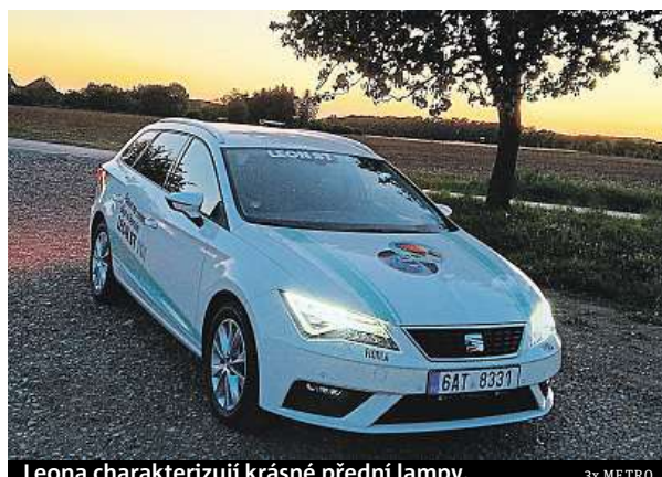
Leona charakterizují krásné přední lampy.