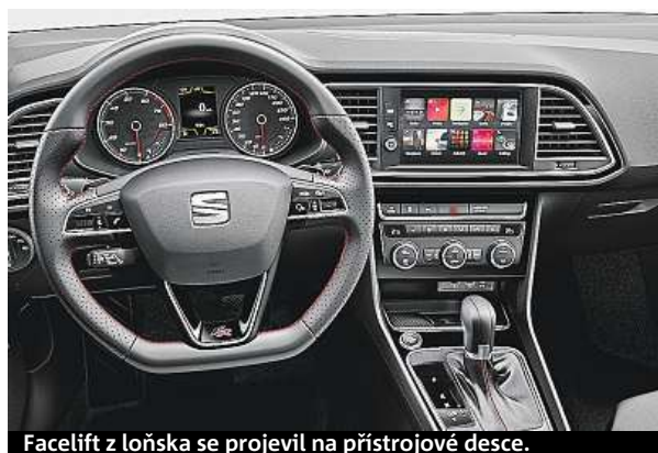
Facelift z loňska se projevil na přístrojové desce.