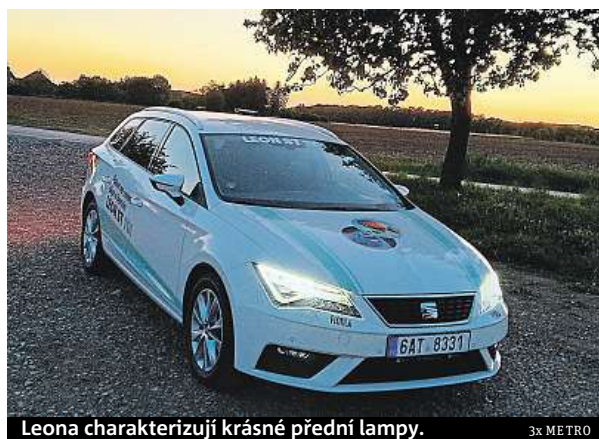
Leona charakterizují krásné přední lampy.