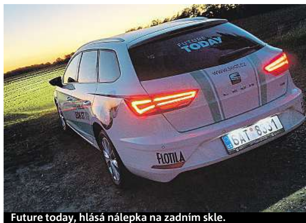
Future today, hlásá nálepka na zadním skle.