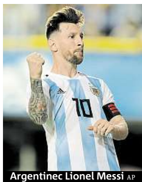
Argentinec Lionel Messi

Smutná zpráva pro Egypt přišla z Liverpoolu. Útočník obou celků Mohamed Salah totiž zmešká začátek mistrovství světa. Kvůli poraněnému ramenu z finále Ligy mistrů bude chybět až čtyři týdny. Egypt vstoupí do MS 15. června zápasem s Uruguayí. O čtyři dny později ho čeká Rusko a 25. června Saúdská Arábie.