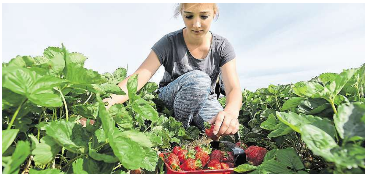
Na Zlínsku začal samosběr jahod. Na rozdíl od loňského roku, kdy úrodu poškodily mrazy, se nyní očekávají červeně žně. ČTK

Hrozba. Z malých měst mohou zmizet obchody a opravny. Nová generace. Zkouší on-line podnikání nebo hledá teplá místa. Byrokracie. Podle průzkumu může živnostník strávit papírováním až měsíc a půl STRANA 2