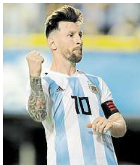
Argentinec Lionel Messi

Smutná zpráva pro Egypt přišla z Liverpoolu. Útočník obou celků Mohamed Salah totiž zmešká začátek mistrovství světa. Kvůli poraněnému ramenu z finále Ligy mistrů bude chybět až čtyři týdny. Egypt vstoupí do MS 15. června zápasem s Uruguayí. O čtyři dny později ho čeká Rusko a 25. června Saúdská Arábie.