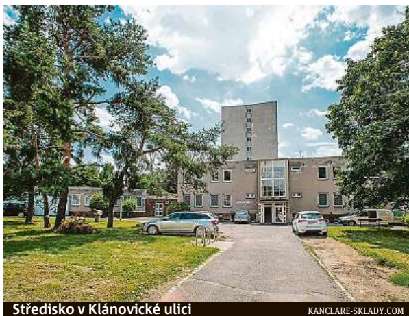
Středisko v Klánovické ulici

Faktem je, že desetipatrová budova zde může vzniknout již dnes, a to bez dohody o směně pozemku s městskou částí. Chybělo by v ní ale zdravotní středisko, jehož