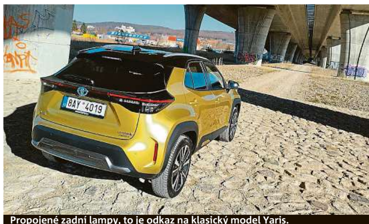
Propojené zadní lampy, to je odkaz na klasický model Yaris.