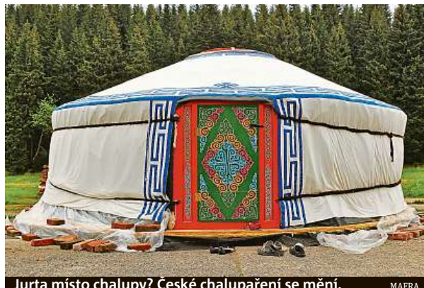
Jurta místo chalupy? České chalupaření se mění.

Covidová pandemie podpořila trend, že lidé kupují všechno, stav nemovitosti není až tak podstatný. „Většina lidí počítá s tím, že si budou chalupu rekonstruovat podle vlastního vkusu. Klíčovou roli zde hraje lokalita. Nejluxusnější jsou místa v národních parcích, CHKO nebo