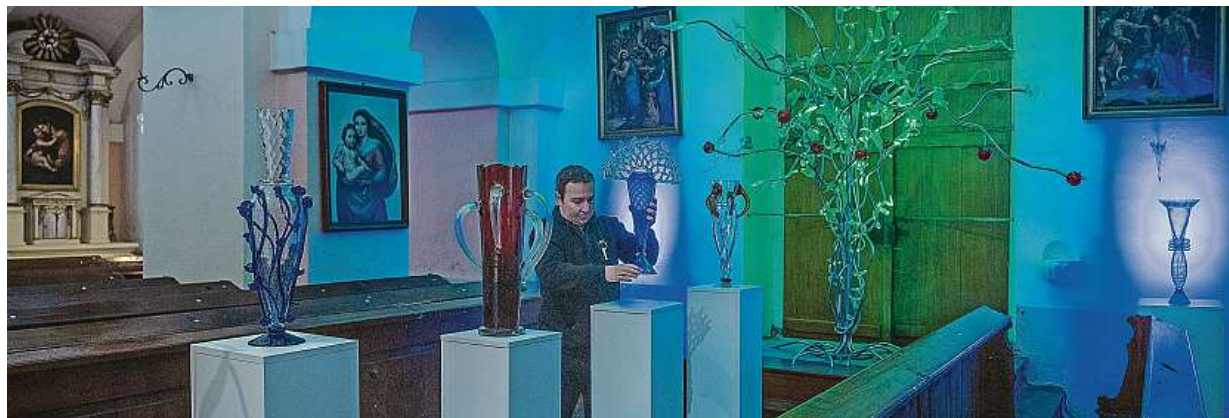
V Křišťálovém chrámu v Kunraticích u Cvikova chystají retrospektivní výstavu architekta, designéra a vizionáře Bořka Šípka.

Nemovitosti. Ceny chat a chalup šly od koronavirové pandemie extrémně nahoru. Prodej. Do jednoho měsíce. Nedostatek financí. Řešení se vždycky najde. Kontakt s přírodou. Ve stanu či maringotce STRANA 6