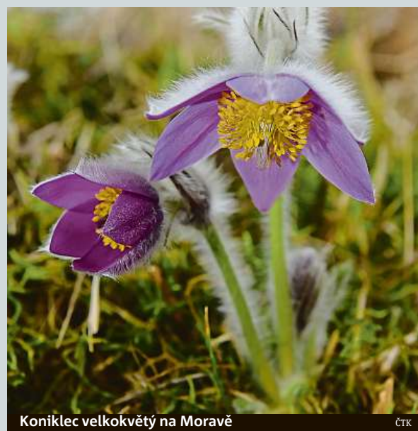
Koniklec velkokvětý na Moravě

V jedné lokalitě na Olomoucku opět rozkvetly chráněné koniklice velkokvěté. Například na Ústecku chrání koniklec luční, další ohroženou rostlinu, speciální klece z pletí-