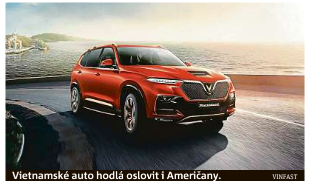
Vietnamské auto hodlá oslovit i Američany.

Automobilka má již pobočky v USA, Kanadě, Německu, Francii a Nizozemsku a v lednu oznámila, že plánuje výstavbu výrobního závodu v Německu, upozornila agentura DPA. ČTK