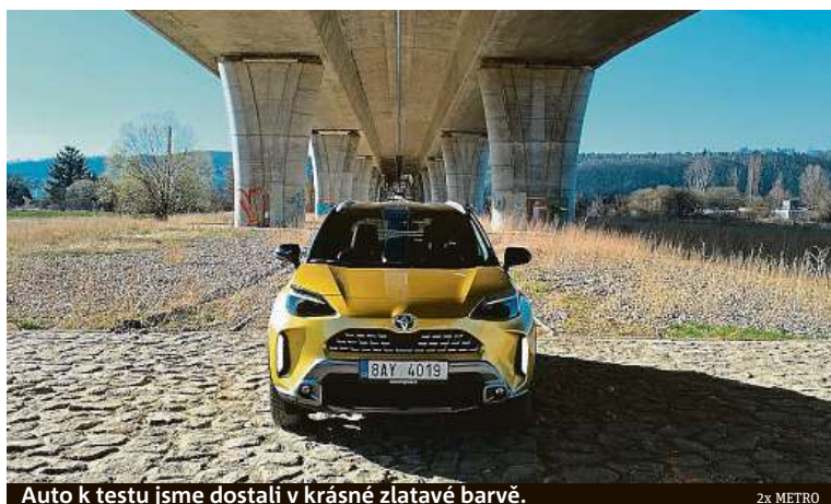
Auto k testu jsme dostali v krásné zlatavé barvě.