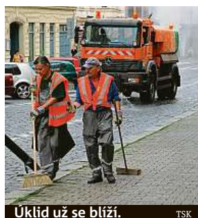
Úklid už se blíží. TSK