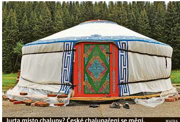
Jurta místo chalupy? České chalupaření se mění.

Covidová pandemie podpořila trend, že lidé kupují všechno, stav nemovitosti není až tak podstatný. „Většina lidí počítá s tím, že si budou chalupu rekonstruovat podle vlastního vkusu. Klíčovou roli zde hraje lokalita. Nejluxusnější jsou místa v národních parcích, CHKO nebo