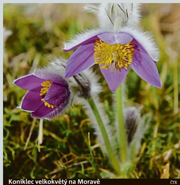
Koniklec velkokvětý na Moravě

V jedné lokalitě na Olomoucku opět rozkvetly chráněné koniklice velkokvěté. Například na Ústecku chrání koniklec luční, další ohroženou rostlinu, speciální klece z pletí-