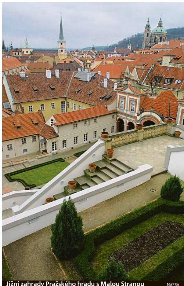
Jižní zahrady Pražského hradu s Malou Stranou