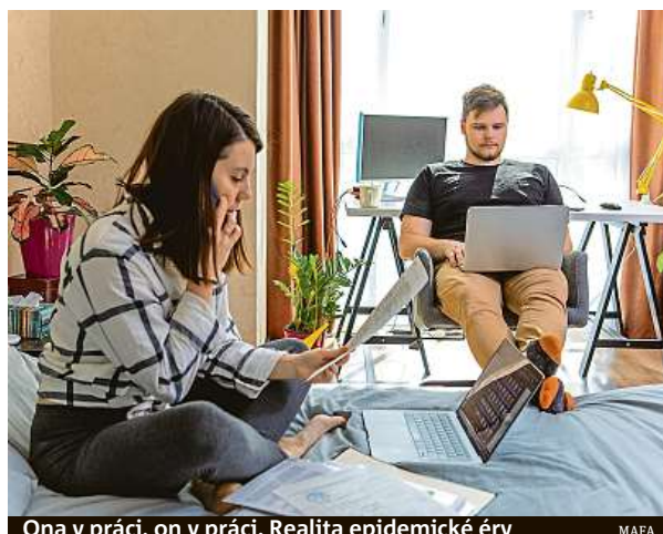
Ona v práci, on v práci. Realita epidemické éry

„Řada firem do padesáti zaměstnanců překvapivě nevyužívá video hovory pro týmovou práci. Ty jsou běžné spíše ve větších firmách. Děti školou povinné tak paradoxně komunikují s učiteli lépe než většina jejich rodičů na home officu. Dalším problémem je absence plynového přístupu do firemních aplikací, nestabilita připoje-