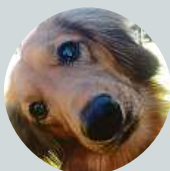
Miroslav Píjak U budov u mě vítězí Crystal na Vinohradech.