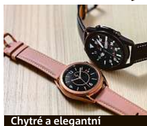
Chytré a elegantní

No dobře, to možná trochu přeháníme, ale praktičnost měření fyzické aktivity a upozorňování na příchozí notifikace na svém zápěstí si již zamilovaly desítky milionů lidí po celém světě. Patříte-li ke staromilcům, kterým se nelíbí hranaté krabičky na zápěstí, preferujete klasický