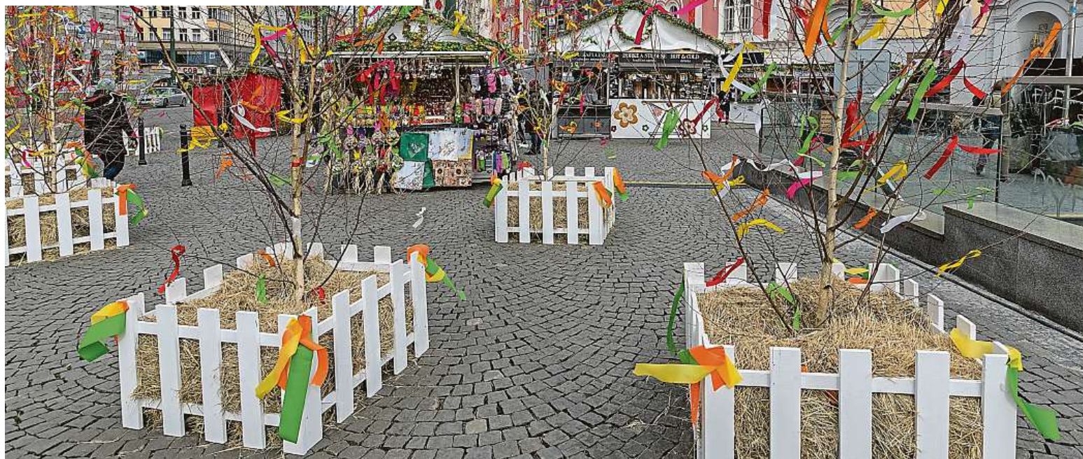
Česká metropole se letos bude muset obejít také bez tradičních velikonočních trhů, například na Staromáku nebo na náměstí Republiky (na snímku).