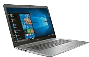
HP 250 G7

Studenti i zaměstnanci, všichni se potýkáme s alespoň nějakými dopady stávající situace na náš běžný život a většinou potřebujeme po našem boku výkonné technologické pomocníky. Jenže kde sehnat stroj, který zvlád-