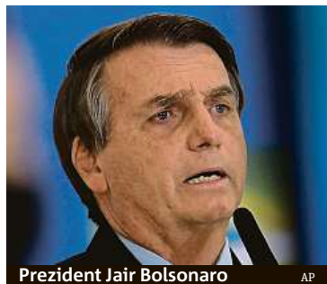
Prezident Jair Bolsonaro

V zemi, kde na covid umírá každý třetí člověk na planetě, nemají celostátní karanténu.