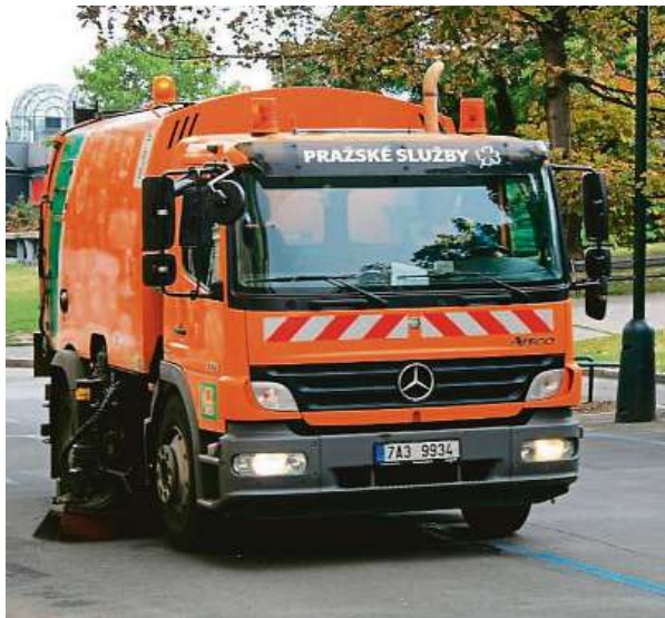
Cištění ulic proběhne také v okolí Václavského náměstí. TSK

V prvním týdnu vyčistí pracovníci z TSK ulice v městských částech Praha 2, 4, 5, 6, 8, 9, 11, 15, 16 a 17. V těch následujících se pak pustí do zbylých částí metropole podle předem schváleného harmonogramu.