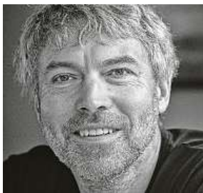
Petr Kellner

Úmrtí Petra Kellnera by mohlo znamenat i přepsání žebříčku nejbohatších Čechů.