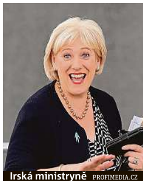
Irská ministryně

„V rámci zotavení se z dopadů pandemie covidu-19 máme jedinečnou příležitost