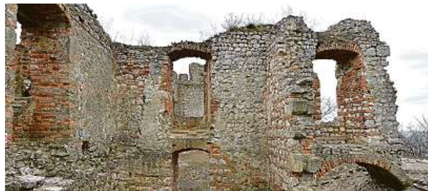
Zřícenina gotického hradu Děvičky