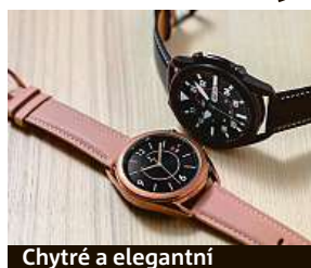
Chytré a elegantní

No dobře, to možná trochu přeháníme, ale praktičnost měření fyzické aktivity a upozorňování na příchozí notifikace na svém zápěstí si již zamilovaly desítky milionů lidí po celém světě. Patříte-li ke staromilcům, kterým se nelíbí hranaté krabičky na zápěstí, preferujete klasický