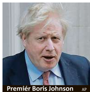
Premiér Boris Johnson

Zhruba před týdnem mluvčí úřadu britského premiéra dementoval informace, po-