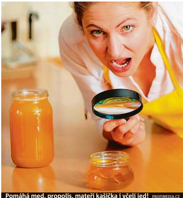
Pomáhá med, propolis, mateří kašička i včelí jed!

Přírodní „sladidlo“ nabízí mnoho užitečných látek, včetně minerálů. Například draslík se hodí při chřipce a horečnatých chorobách, železo podporuje krvetvorbu, také proto lze med doporučit lidem při chemoterapii. Ráno byste si na lžici medu měli po-