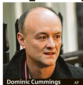
Dominic Cummings

dle nichž Cummings koncem ledna odmítl striktní opatření k omezení šíření koronaviru. Jeho postoj list Sunday Times, který tuto zprávu zveřejnil, shrnul slovy: „Jestli to