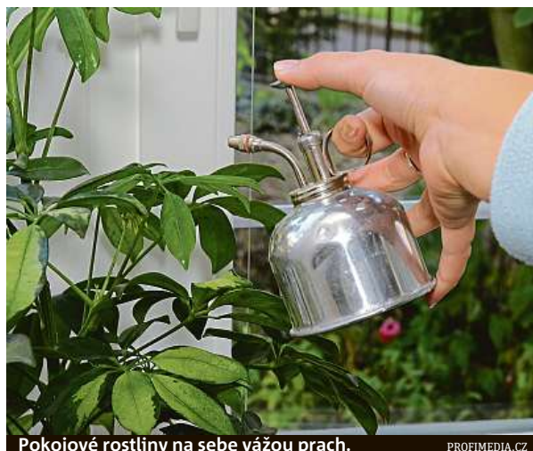
Pokojové rostliny na sebe vážou prach.

Snažte se zbytečně nevířit prach a alespoň jednou týdně jej otírat z nábytku. Místo prachovky použijte raději vlhké hadříky a po použití je nezapomeňte vyprat. Pokud jste alergici, minimalizujte bytové textilie, jako jsou závěsy, záclony, přehozy, ubrusy, ale i čalouněný nábytek. Také raději vysávejte, než zametajte, a vysavače volte s vysokým sa-