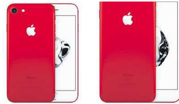
Červený iPhone 7

Poté, co jsme měli možnost telefon vidět na vlastní oči, musíme uznat, že je rozruch zasloužený. Výrazná barva iPhoneu sluší a na rozdíl od konkurenčních mobilů se nedá říct, že by byl určený jen pro ženy. Provedením se jedná o unisex a dobře bude vypadat i v mužských rukou.