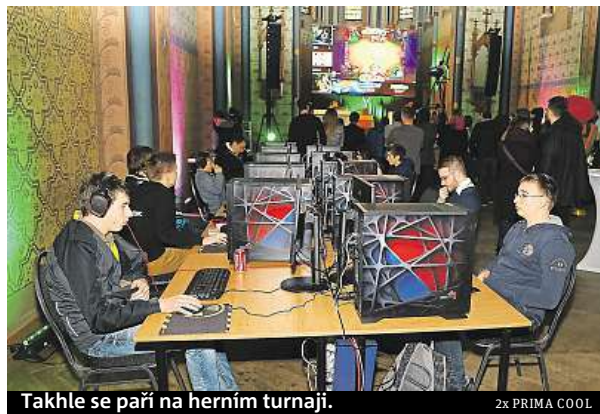
Takhle se paří na herním turnaji.