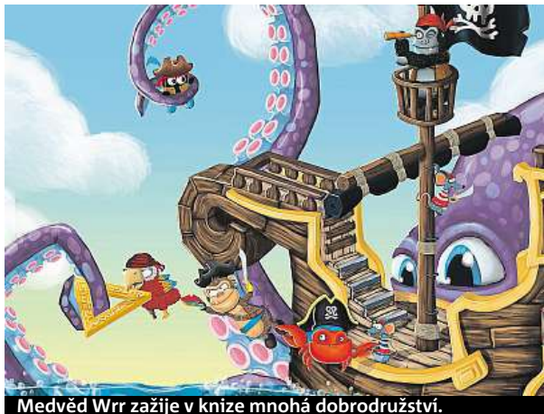
Medvěd Wrr zažije v knize mnohá dobrodružství.

Dospěli jsme do stadia, kdy po sobě chceme něco zanechat. S kolegou jsme vymysleli postavku medvěda Wrr, který byl hlavní tváří našeho