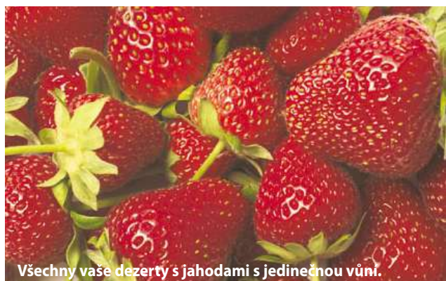
Všechny vaše dezerty s jahodami s jedinečnou vůní.