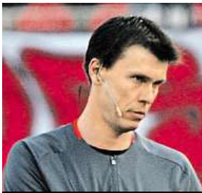
Při prvním derby MAFRA

Poprvé ho komise na derby delegovala v dubnu 2007, tenkrát byl mezi elitními sudími první sezony. Zápas řídil s nadhledem, v duchu pravidel, byl velkorysý, udělil jen