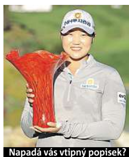
Napadá vás vtipný popisěk?