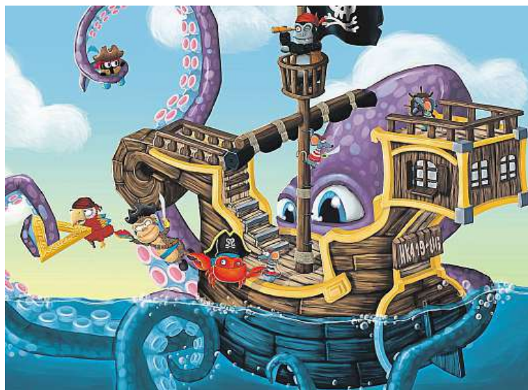
Medvěd Wrr zažije v knize mnohá dobrodružství.

DAIKIN DEVICE CZECH REPUBLIC, s.r.o., Švédské valy 2, 627 00, Brno, +420 517 547 310, prace@daikinbrno.cz