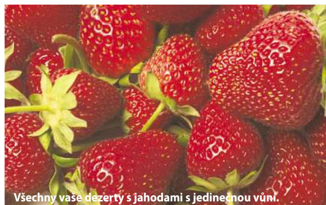
Všechny vaše dezerty s jahodami s jedinečnou vůní.