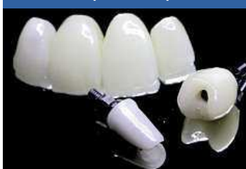
Laboratorní protetická práce