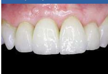
Konečný stav po zákroku