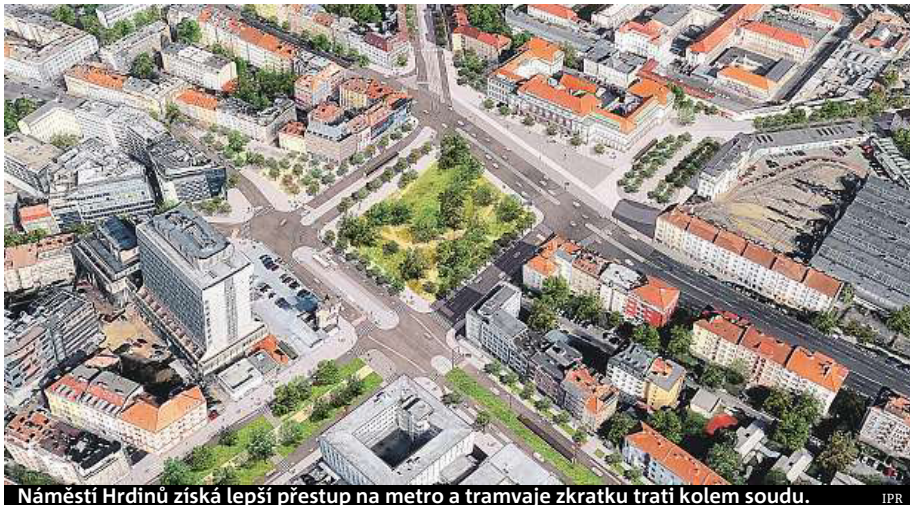
Náměstí Hrdinů získá lepší přestup na metro a tramvaje zkratku trati kolem soudu. IPR

Už v polovině května se zakousnou bagry do starých kolejí a chodníků na Nuselské. Úprava čeká třeba obě náměstíčka – Horky i Kloboučnickou. „Prostranství budou doplněna lavičkami a náměstí Horky bude mít své specifické lavičky kolem kmenů nových stromů.“ popisuje ředitel Institutu plánování a roz-