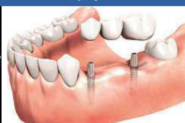
Náhrada tří chybějících zubů