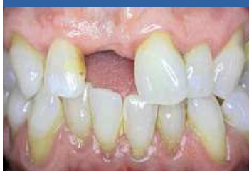
Situace před zákrokem