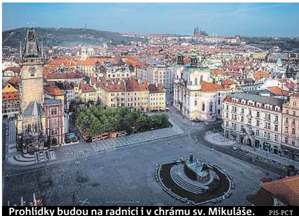
Prohlídky budou na radnici i v chrámu sv. Mikuláše.