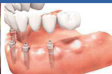
Kompletní náhrada dentice bezzubé čelisti