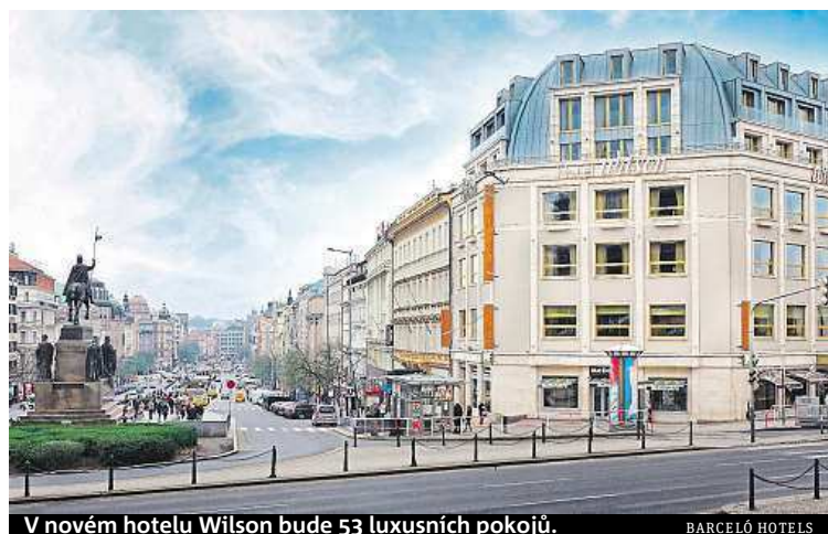
V novém hotelu Wilson bude 53 luxusních pokojů. BARCELÓ HOTELS

Když se řekne Dům potravin, představí si starší Pražané vybrané delikatesy a nedostatkové zboží, na které se na Václaváku v dobách komunismu stávaly dlouhé fronty.