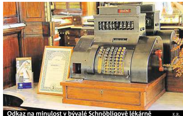
Odkaz na minulost v bývalé Schnöbligově lékárně K.R.

Úplně nejstarší byla lékárna v Týnském dvoře. Další vznikaly postupně, zprvu při klášterech a špitálech a poté i jako měšťanské praxe. Další historický skvost můžete navštívit na Malém náměstí – Schnöbligovu lékárnu sídlící v historickém domě U Koruny, kterou zde později nahradilo zlatnictví. „Úvodní gotický dům z roku 1378 byl v prů-