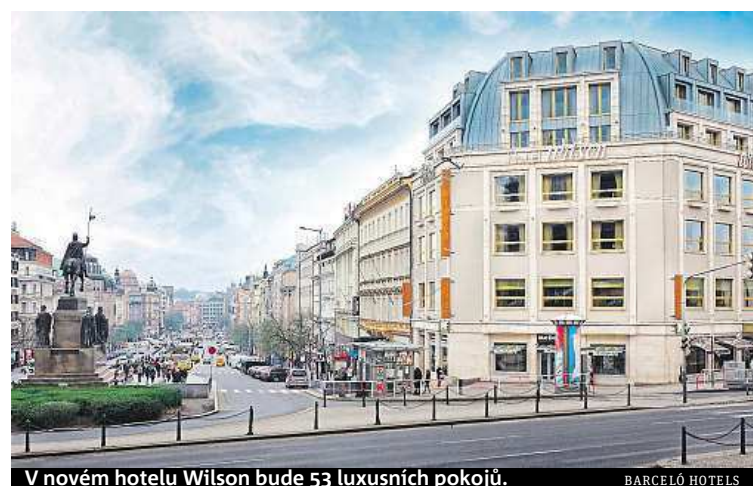
V novém hotelu Wilson bude 53 luxusních pokojů. BARCELÓ HOTELS

Když se řekne Dům potravin, představí si starší Pražané vybrané delikatesy a nedostatkové zboží, na které se na Václaváku v dobách komunismu stávaly dlouhé fronty.