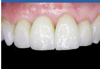
Konečný stav po zákroku