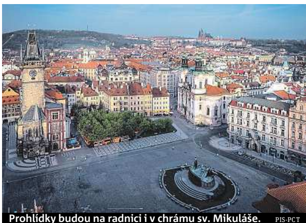
Prohlídky budou na radnici i v chrámu sv. Mikuláše.