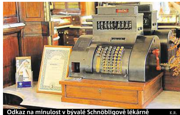
Odkaz na minulost v bývalé Schnöbligově lékárne K.R.

Úplně nejstarší byla lékárna v Týnském dvoře. Další vznikaly postupně, zprvu při klášterech a špitálech a poté i jako měšťanské praxe. Další historický skvost můžete navštívit na Malém náměstí – Schnöbligovu lékárnu sídlící v historickém domě U Koruny, kterou zde později nahradilo zlatnictví. „Úvodní gotický dům z roku 1378 byl v prů-