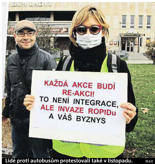
Lidé proti autobusům protestovali také v listopadu. MAH

Vhodnost Ládví měla posoudit studie ČVUT, ta jako další varianty, kde by mohly autobusy stavět, posuzovala i nádraží v Letňanech, Holešovicích a ve Střížkově. MAH