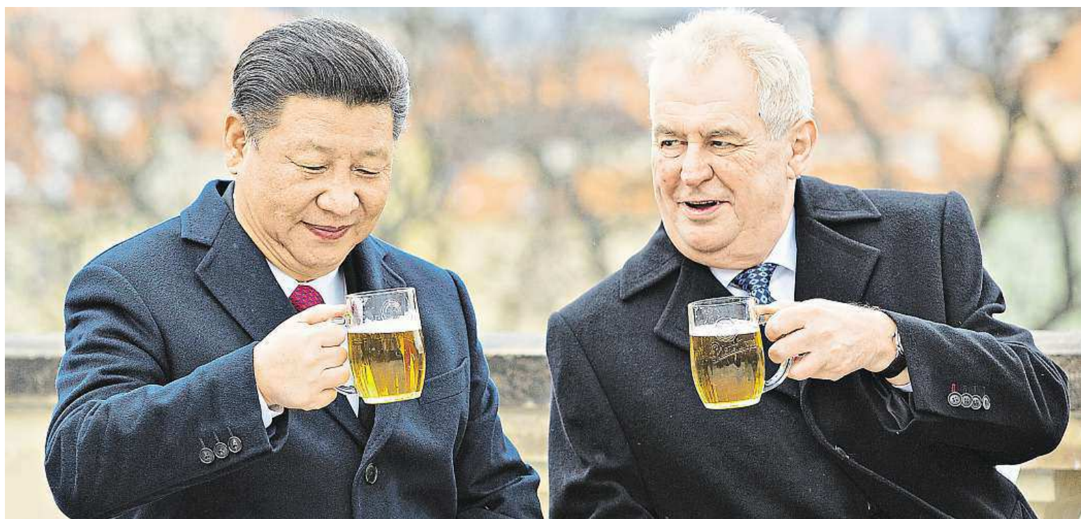
Prezident Miloš Zeman a jeho čínský protějšek Si Tin-pching si večera na závěr návštěvy v Česku připili pivem na terase Strahovského kláštera v Praze.

Sociální sítě. Návštěva čínského prezidenta v Praze vedla k lidové tvořivosti. Nápis na billboardu. Každý ho mohl předělat podle sebe. Slováci. Kvůli byznysu s Čínou Češi přehlížejí porušování lidských práv STRANY 2 A 6