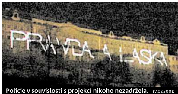
Policie v souvislosti s projekcí nikoho nezadržela. FACEBOOK