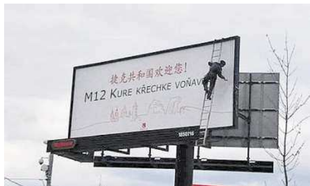
Text billboardu je možné změnit dle libosti. CINANI.KVALITNE.CZ

Smysl pro humor ale Češi ani tak neztratili. Vtípu neunikl ministr financí Andrej Babiš. K fotce, na které si podává ruku s čínským prezidentem, někdo přidal nápis: „A jak to máte s dotacema? Postavil bych Pandí hnízdo!“ Narážka na pandu byla namístě. Jedno z témat návštěvy byla totiž i možnost získat pandu velkou do pražské zoo. Terčem fotomontáže se stal také Miroslav Kalousek. Toho v úterý fotografy zachytili, jak s tibetskou vlajkou skanduje v Loretánské ulici. Na internetu pak začala kolovat fotka, kde Kalousek s vlajkou v ruce velí k útoku na Peking. JAR, MAH