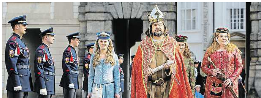
Karel IV. přijede v čele historického průvodu na koni. Snímek je z minulého roku.