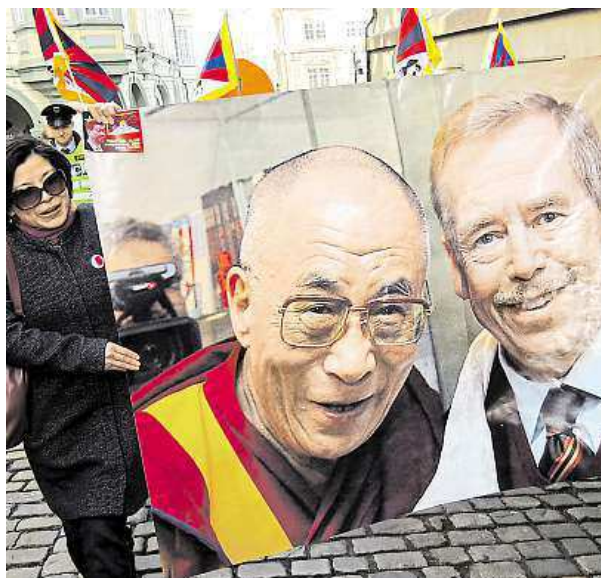
V Praze se i včera demonstrovalo.