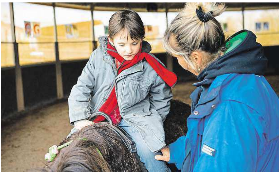
Hiporehabilitace pomáhá nemocným dětem.