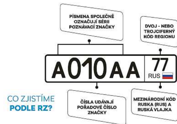
Jak číst skutečnou ruskou registrační značku?