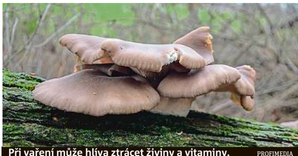
Při vaření může hlíva ztrácet živiny a vitamíny.

Houby jsou z velké většiny složeny z vody – obsahují jí až 92 procent. Obsah bílkovin je relativně nízký, činí jedno až dvě procenta, sacharidů je v nich až čtyři procenta, tuků zhruba tři procenta.