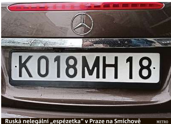
Ruská nelegální „espézetka“ v Praze na Smíchově

Západ je pro Rusy nepřítel. I ti, kteří podporují prezidenta Putina a jeho „speciální operaci“, se ale nechťejí vzdát vymožeností západní civilizace a jejího luxusu. Ti, kterým se podaří přes třetí země projet do západní Evropy vlastním autem, dělají všechno pro to, aby jejich vo-