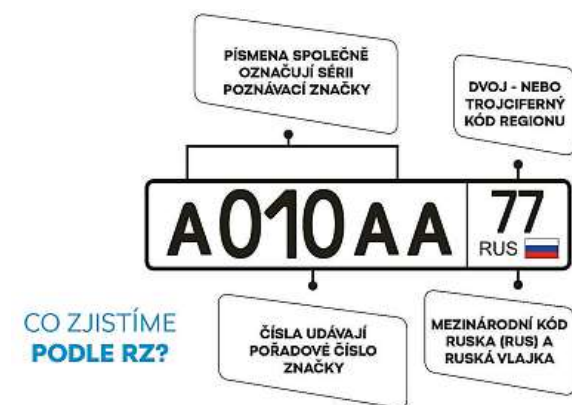
Jak číst skutečnou ruskou registrační značku?