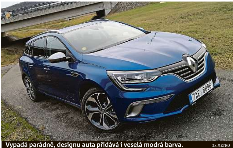
Vypadá parádně, designu auta přidává i veselá modrá barva.