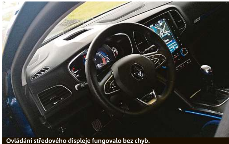
Ovládání středového displeje fungovalo bez chyb.