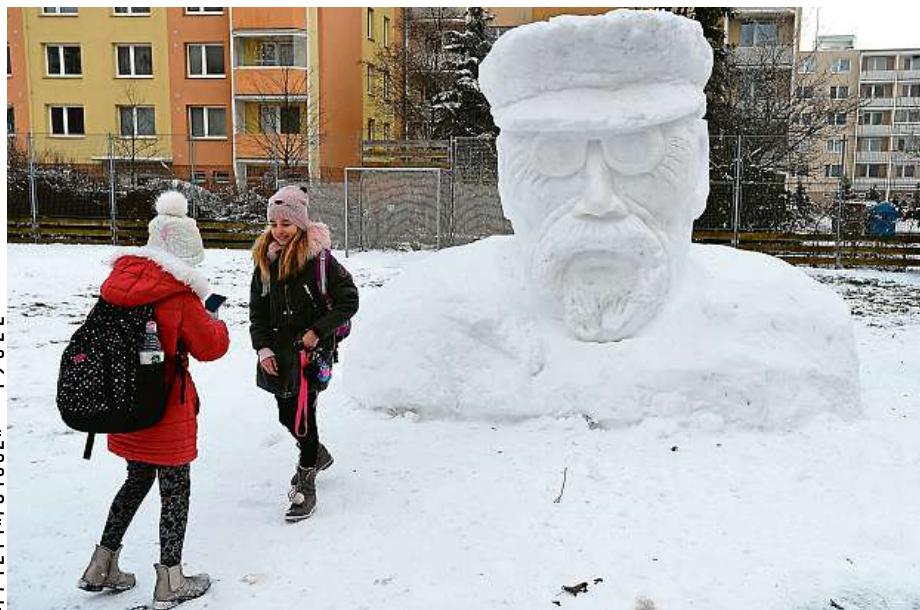
Asi 2,5 metru vysoká sněhová busta prezidenta T. G. Masaryka stojí na sídlišti v Prostějově.

Ministerstvo financí varuje: Účastí na hazardní hře může vzniknout závislost! 18+