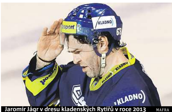
Jaromír Jágr v dresu kladenských Rytiřů v roce 2013 MAPRA

Český útočník se v nejbližších dnech připojí k týmu Rytiřů. Informace o přiletu hrající legendy z Calgary jsou tajné, ale je jisté, že doma se Jágr musí objevit do dneška. Potřebuje totiž absolvovat zdravotní prohlídku nutnou k uzavření svého přesunu z NHL do druhé nejvyšší domácí soutěže. „Proces návratu Jaromíra Jágra začal už po nočním oznámení jeho odchodu z Calgary. Začali jsme Jaromírovi vyřizovat transferkartu z Calgary do Kladna. Dalším krokem je sepsání hráčské smlouvy, což je samozřejmě formalita, protože je majitel klubu. Třetí věc je zdravotní prohlídka, kterou musí absolvovat ve středu,“ řekl mluvčí kladenského klubu Vít Heral.