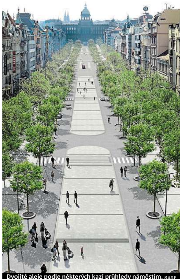
Dvojitě aleje podle některých kazí průhledy náměstím. MHMP

„Václavské náměstí je jedno z nejvýznamnějších míst nejen v Praze, ale i v celé republice, a to jak aktuálně, tak v rámci historického kontextu. Přesto dnes neplní funkci, jakou by mělo, a lidé jím v podstatě jen procházejí. Chci, aby se z něj opět stalo centrum sociálního, kulturního a společenského života, tak jak to bylo v minulosti,“ dodává primátorka Krnáčová. FILIP JAROŠEVSKÝ