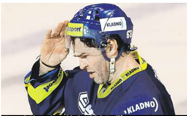
Jaromír Jágr v dresu kladenských Rytiřů v roce 2013

Český útočník se v nejbližších dnech připojí k týmu Rytiřů. Informace o přiletu hrající legendy z Calgary jsou tajné, ale je jisté, že doma se Jágr musí objevit do dneška. Potřebuje totiž absolvovat zdravotní prohlídku nutnou k uzavření svého přesunu z NHL do druhé nejvyšší domácí soutěže. „Proces návratu Jaromíra Jágra začal už po nočním oznámení jeho odchodu z Calgary. Začali jsme Jaromírovi vyřizovat transferkartu z Calgary do Kladna. Dalším krokem je sepsání hráčské smlouvy, což je samozřejmě formalita, protože je majitel klubu. Třetí věc je zdravotní prohlídka, kterou musí absolvovat ve středu,“ řekl mluvčí kladenského klubu Vít Heral.