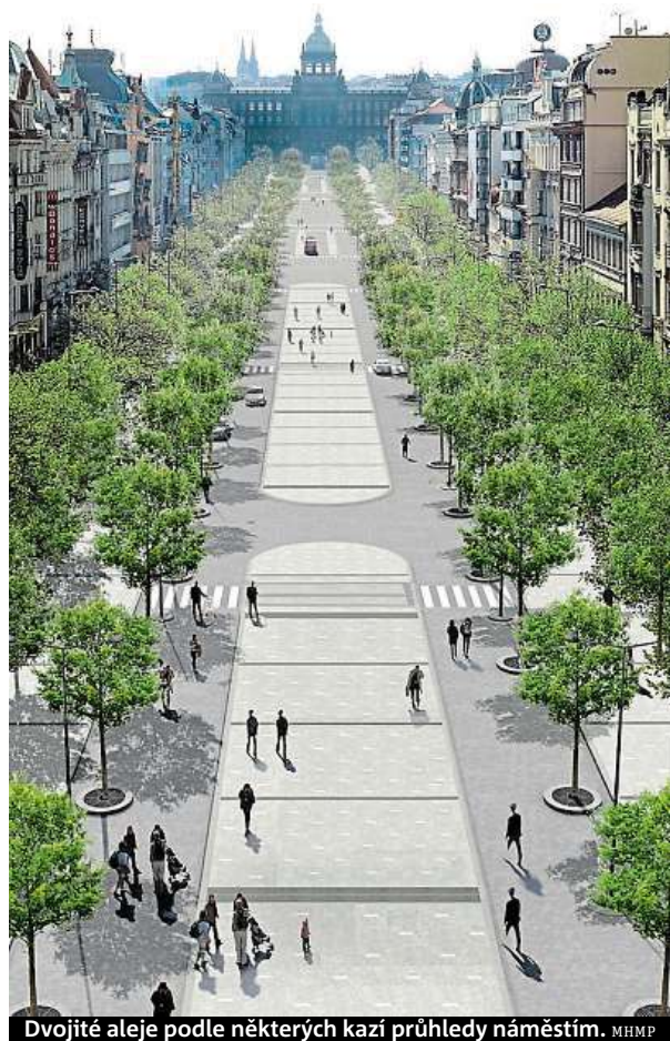
Dvojitě aleje podle některých kazí průhledy náměstím. MHMP

„Václavské náměstí je jedno z nejvýznamnějších míst nejen v Praze, ale i v celé republice, a to jak aktuálně, tak v rámci historického kontextu. Přesto dnes neplní funkci, jakou by mělo, a lidé jím v podstatě jen procházejí. Chci, aby se z něj opět stalo centrum sociálního, kulturního a společenského života, tak jak to bylo v minulosti,“ dodává primátorka Krnáčová. FILIP JAROŠEVSKÝ