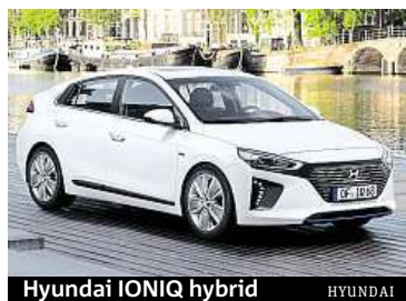
Hyundai IONIQ hybrid

Korejský ekonomický zázrak štědrě podporovaný státem přinesl nejen celosvětovou známost řady korejských značek, ale také dostatek volného kapitálu. Není proto divu, že se tamní firmy poohlížejí po investič-