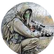
Bukaj Rakeip Já R.ozumně U.loženou M.edicinou.