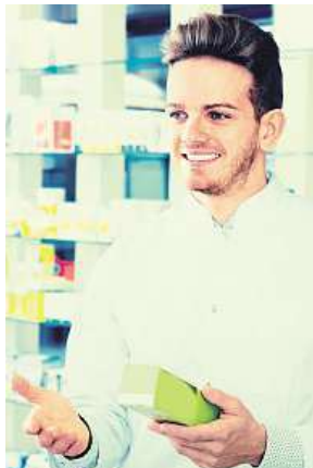
Levnější léky?

Podle propočtů ministerstva zdravotnictví vydají v případě schválení novely zdravotní pojišťovny nově ročně asi o 440 milionů korun více než v současnosti. Největší dopady, asi 295 milionů korun, se očekávají u Všeobecné zdravotní pojišťovny (VZP), která je největší. „VZP bude respektovat platnou legislativu. Předpokládáme, že pokud se zákonodárce rozhodne jít touto cestou, bude pamatovat i na to, že tím vzrostou výdaje z veřejného zdravotního pojištění