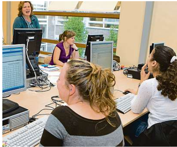
Hlavním motivátorem dětí ve vzdělávání však stále zůstává pedagog, a to i v případě mimoškolních projektů.