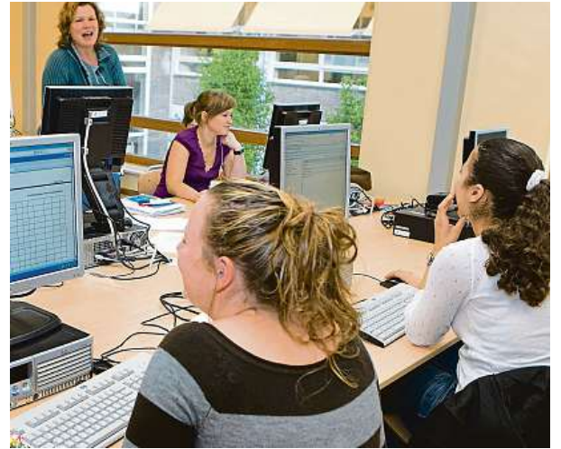
Hlavním motivátorem dětí ve vzdělávání však stále zůstává pedagog, a to i v případě mimoškolních projektů.