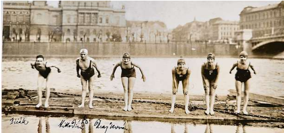
Historický snímek pražských otužilců. Stejný je i na obálce knihy.