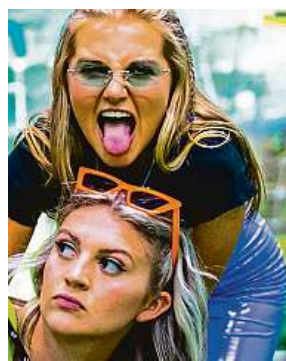
Kde jsou hranice? FILMEUROPE

mít sex, ve kterém se spolu se třemi teenagerkami divák vydává do víru divokých parties na řeckých ostrovech, je podmanivou a devastující cestou do temných zákoutí dospívání i pohledem na složitost ženského přátelství a sexualitu dospívajících. Hlavním tématem snímku je však tabuizované téma znásilnění a hranic souhlasu. MET