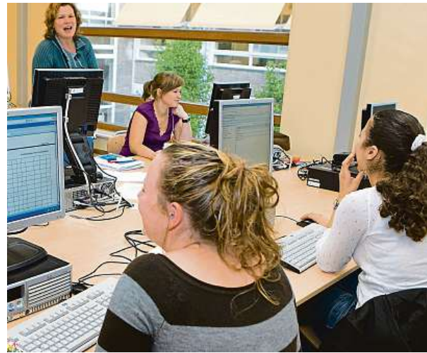
Hlavním motivátorem dětí ve vzdělávání však stále zůstává pedagog, a to i v případě mimoškolních projektů.