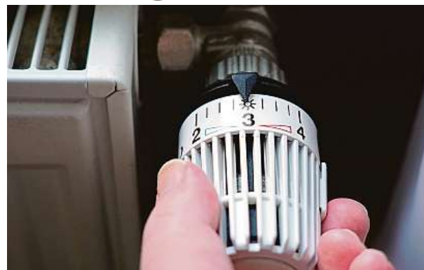
Dopady případných vyšších záloh na ekonomickou situaci domácností jsou navíc mírnější než letos v lednu.

Od ledna 2023 naopak ubylo zákazníků, jimž jejich dodavatel oznámil zvýšení záloh za energie, naopak vzrostl podíl těch, kteří mají zálohy