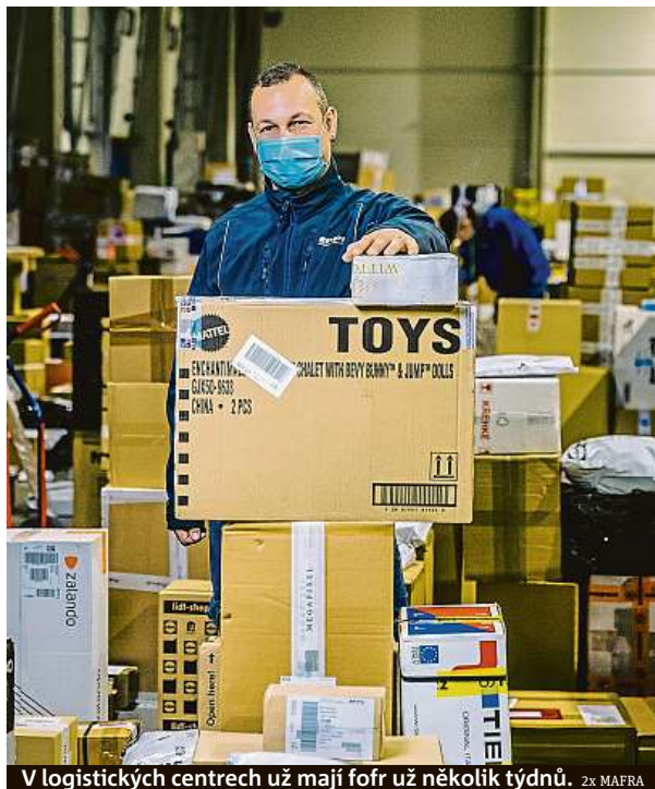
V logistických centrech už mají fofr už několik týdnů.

„Loni se začínalo vozit bez záruky doručení na čas tak v půlce prosince. Letos to platí už od tohoto týdne,“ říká jeden z pražských cyklokurýrů. Pokud si objednáte doručení, musíte přijmout fakt, že balíček dorazí sice ten samý den, ale třeba dodání do dvou hodin od objednání zásilky se pravděpodobně dočkat nepodaří. „Hlavní je, aby zásilka došla, čekají nás přeplněné batohy. Nabírat zásilky a vyhazovat na trase.