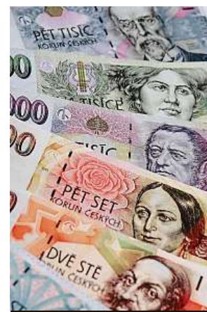
Placení až poté? Proč ne

Téměř dvě třetiny lidí si dokonce myslí, že odložení platby na začátek dalšího roku by měla být standardní služba ze strany obchodníků právě v tomto ročním období. PH