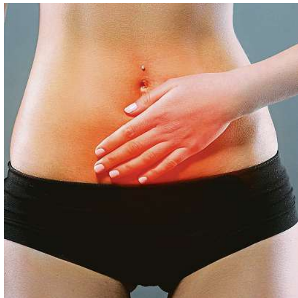
Zánět močového měchýře dokáže velmi potrápít.