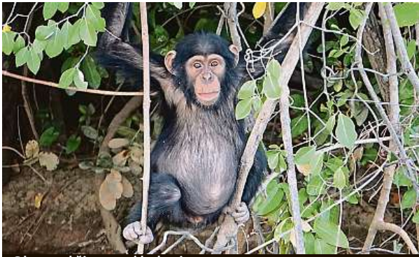
Obyvatel šimpanzí kolonie