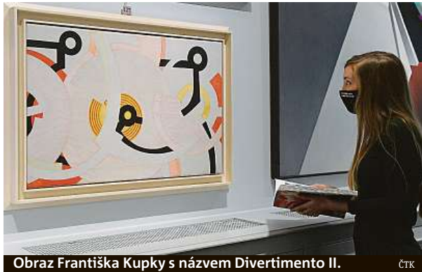
Obraz Františka Kupky s názvem Divertimento II.