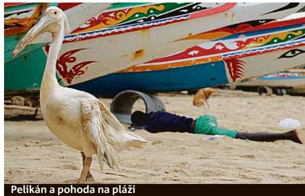
Pelikán a pohoda na pláži

jen málo co funguje tak, jak se zpočátku tváří, nakonec se ukázalo, že místo v 19.00 budeme na místě ve tři ráno. Majitel domu s tím však neměl žádný problém. Vyklubal se z něj potomek libanonsko-francouzského páru, který v Senegal žije od pěti let. Donátor a filantrop, který staví školy a finančně podporuje sportovní kluby. Zadarmo nás osobně vozil po parku, připravil nám hromadu jídla poskládaného z blízkovýchodních specialit, které sám navařil, a řekl nám, že až příš-