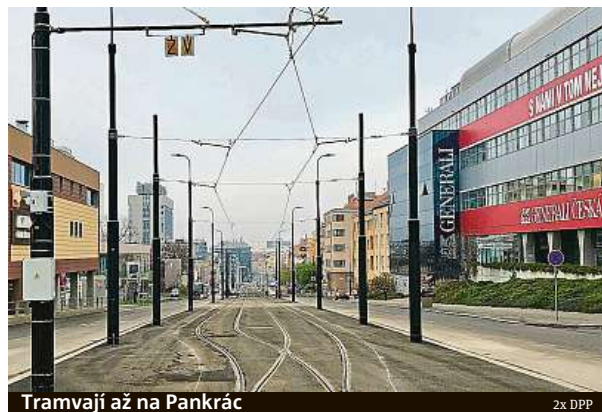
Tramvají až na Pankrác