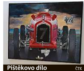
Pištěkovo dílo ČTK

Pištěk na díle pracoval s přestávkami čtvrt století inspirován silným příběhem francouzského automobilového závodníka Guye Molla. Dominantním motivem je automobil Alfa Romeo. ČTK