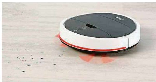
Robotický vysavač Vileda VR 102

Robotický vysavač Vileda VR 102 doporučujeme zakoupit v internetovém obchodě, kde ho najdete za 3090 Kč, což je opravdu úžasná cena za takto praktický přístroj. Zbavte se starostí s luxováním a užijte si ušetřený čas po svém.