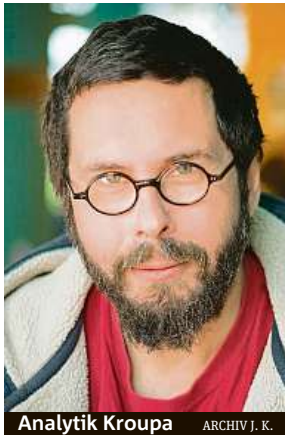
Analytik Kroupa

Porostou ještě víc. Štědrost plodí štědrost, solidarita solidaritu. Samozřejmě lze předpokládat, že jakmile krize pomine, opadne i vlna štědrosti a dárci si budou potřebovat trochu vydechnout. Třeba vel-