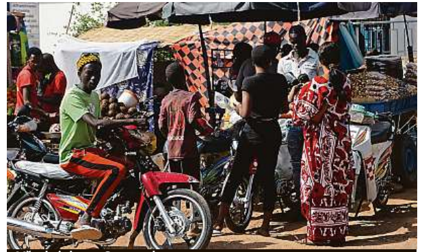
Všední den v Senegalu