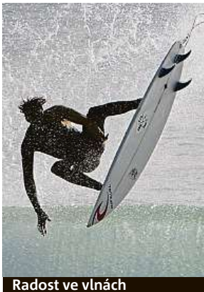
Radost ve vlnách