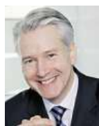
Prof. Dr. Abelse, výzkum společnosti DR. WOLFF

Pocit suché kůže trápí mnoho lidí. Někdy může pomoci jednoduchý hydratační krém nebo přípravek s ureou.