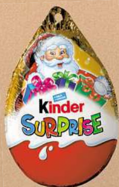
Kinder Surprise Pendant