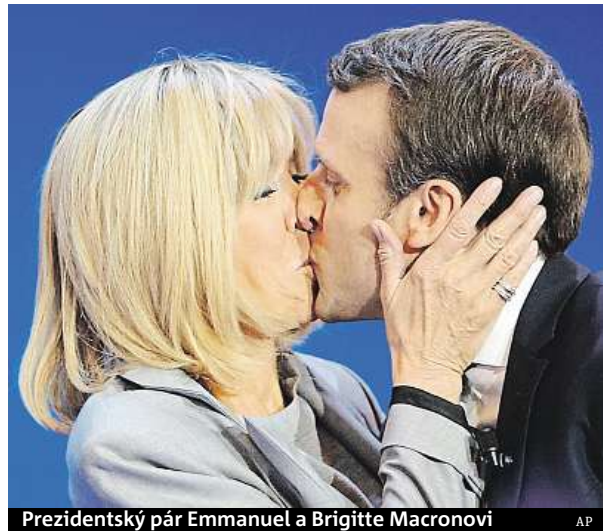
Prezidentský pár Emmanuel a Brigitte Macronovi

Další cena poroty získala první dáma Brigitte Macronová za výrok: Jediná chyba Emmanuela (Macrona) je ta, že je mladší než já. Mezi francouzským prezidentským párem je velký věkový rozdíl pětadvacet let. Emmanuelu Macronovi je 39 let a jeho manželce Brigitte 64 let. Jsou svoji od října 2007. ČTK, MET