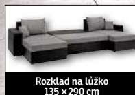
Rozklad na lůžko 135 × 290 cm

Cena platí pouze v termínu 30. 11. - 3. 12. 2017