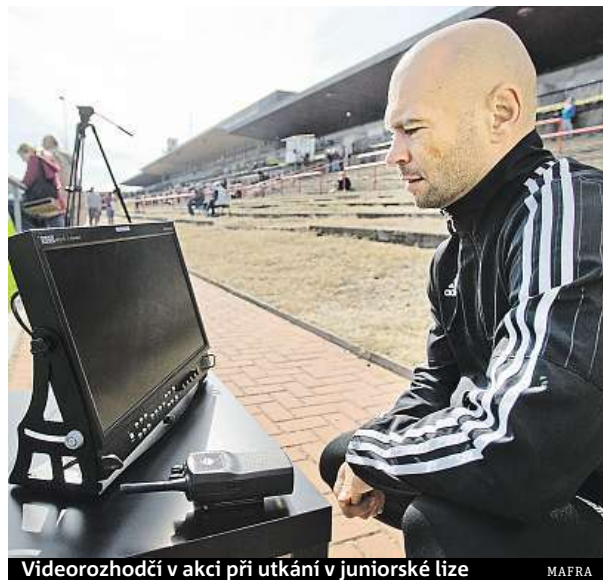
Videorozhodčí v akci při utkání v juniorské lize