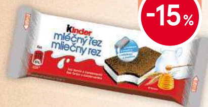
Kinder Mléčný řez