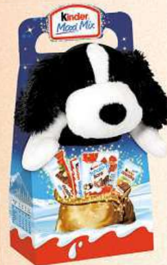
Kinder Maxi Mix s plyšákem, 133 g (100 g = 182,63 Kč)